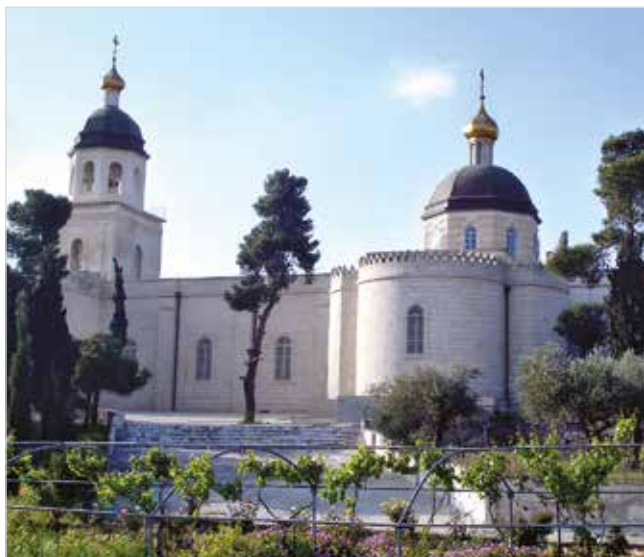
Русский монастырь в Хевроне

— Тем более здесь, в Хевроне, где он жил.