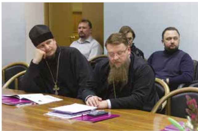
Заседание участников Годичного собрания

проводится по дисциплине «Русский как иностранный». Участие в ней могут принять как граждане иностранных государств, так и проживающие за рубежом российские граждане и соотечественники, обучающиеся в зарубежных образовательных учреждениях.