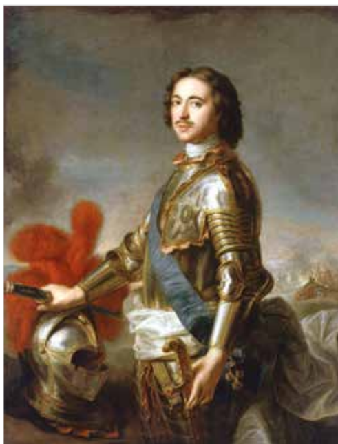
Портрет императора Петра I. Худ. Ж.-М.Натье, 1717 г.

Думаю, мы призваны к глубокому переосмыслению вектора общественного и государ-