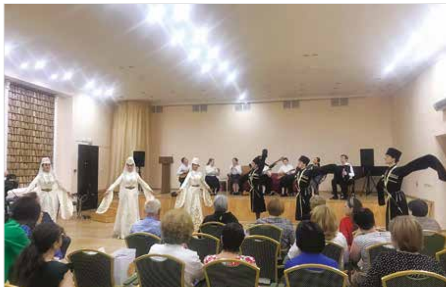
Концерт. Осетинские народные танцы