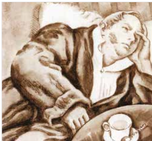
Илья Ильич Обломов

предательством самого себя и Святого Духа в себе. Такие люди, как Александр Адуев, отказавшись от духовной борьбы, еще при жизни сами себя помещают в «ад» — отсюда и фамилия героя. Писатель с горечью признавал, что Адуевы составляют огромное большинство, идущее по жизни «широкими воротами». Поэтому роман построен как развитие евангельской притчи об узких и широких воротах: «Входите тесными воротами, потому что широки врата и пространен путь, ведущие в погибель, и многие идут ими; потому что тесны врата и узок путь, ведущие в жизнь, и немногие находят их» (Мф. 7, 13–14).