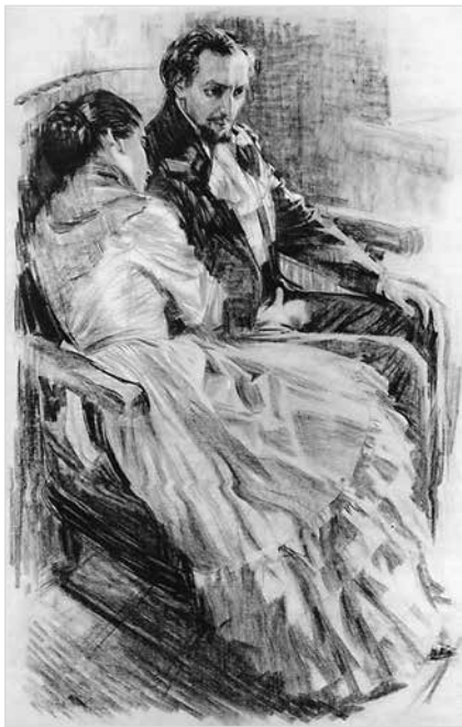
Борис Райский и Вера