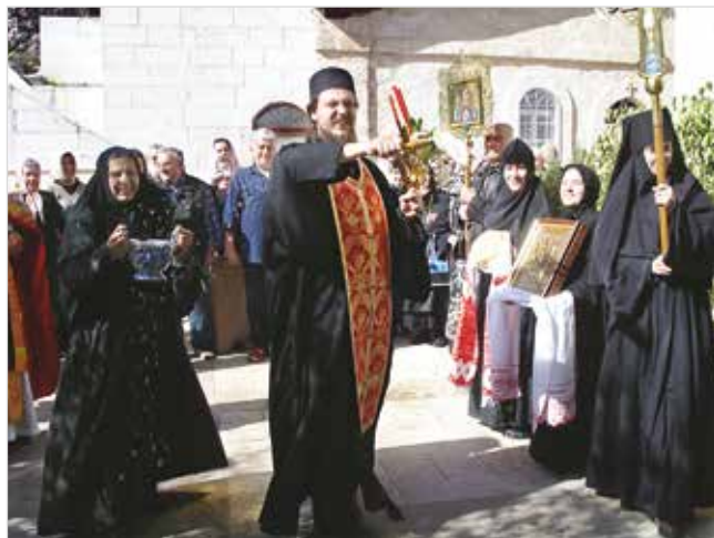
Крестный ход в Горненском монастыре

Но как ехать, если нет денег? Вдруг подходит ко мне моя подруга (ныне духовная сестра