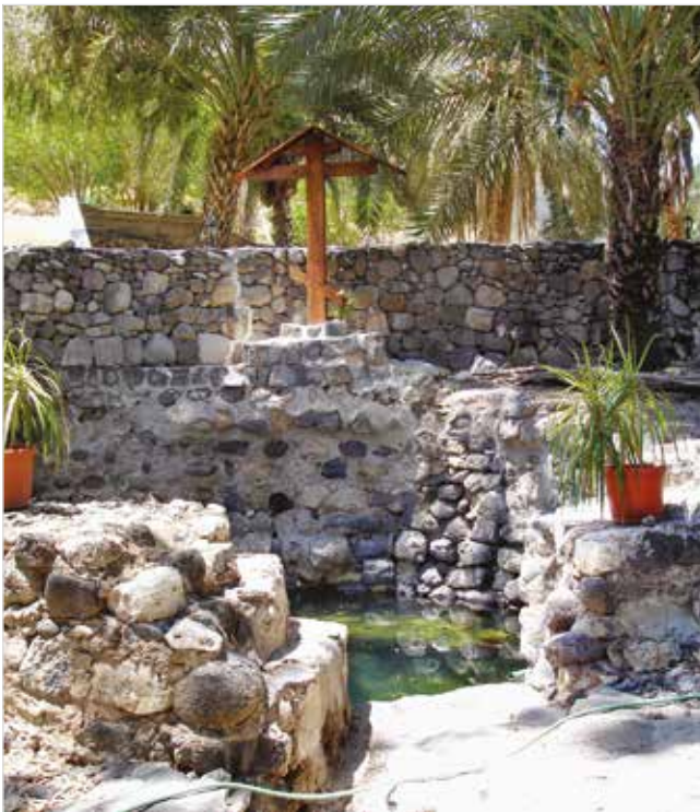
Источник святой Марии Магдалины

Одна женщина приехала с Украины и говорит: «Мой муж в вашем источнике исцелился. У него был сильный ожог руки; врачи ничем не могли помочь, рука начала гноиться. Он искупался в вашем источнике, и рука исцелилась».