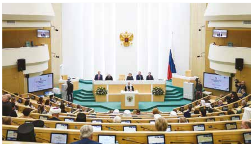
X Парламентские встречи. Москва, Совет Федерации Федерального Собрания Российской Федерации, 17 мая 2022 г.

Поэтому секуляризм как система, определяющая отношения Церкви и государства, вполне приемлем, а в нынешних условиях, наверное, единственно возможен. А вот о каком же секуляризме не может быть и речи, и против какого секуляризма мы как Церковь должны бороться всеми силами? Это политика отделения Церкви от человеческой души, это вытеснение Церкви на периферию общественной и даже личной жизни. Мы же помним, как люди скрывали свою религиозность, боялись сказать о себе как о православных людях — и не только на работе, но порой даже в кругу друзей! Вот та-