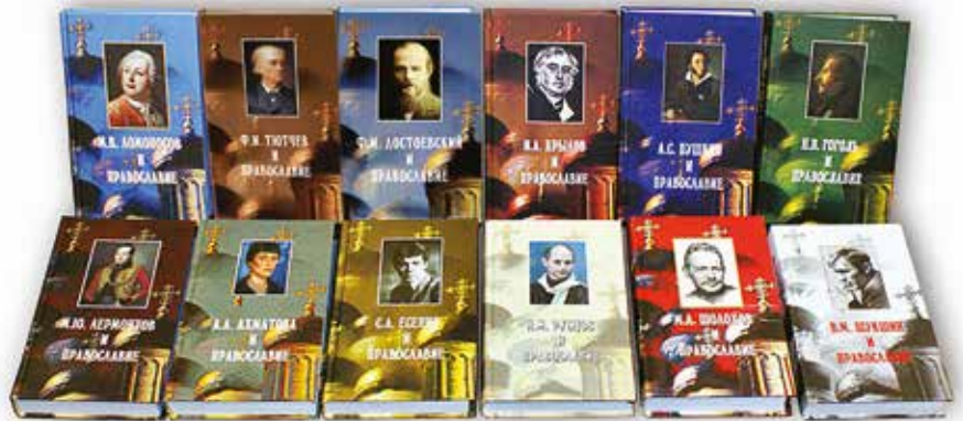
12-томная книжная коллекция «Русские писатели и православие»

Каждая книга удостоивается общественной презентации, в которой участвуют государственные, политические, общественные и религиозные деятели. Например, в презентации книг о Николае Рубцове в 2009 году в Вологде, Михаиле Лермонтове в 2010 году в Пензе и Тарханах, Сергее Есенине в 2011 году в Рязани и Константиново, Василии Шукшине в 2012 году в Барнауле, Сростках и Белграде (Сербия), Михаиле Шолохове в 2013 году в Ростове-на-Дону, станице Вешенской и Вене (Австрия), Михаиле Ломоносове в 2014 году в Архангельске и Холмогорах, Федоре Достоевском в 2015 году в Санкт-Петербурге, Николае Гоголе в 2016 году в Москве и Варне (Болгария), Федоре Тютчеве в 2017 году в Овстуге, Берлине (Германия) и Варне (Болгария), Александре Пушкине в 2017 году в с. Михайловском, Иване Крылове в 2020 году в Санкт-Петербурге, в Российской национальной библиотеке, в которой долгие годы служил в свое время И.А. Крылов, об Анне Ахматовой в 2021 году в Государственном литературно-мемориальном музее Анны Ахматовой в Фонтанном Доме в Санкт-Петербурге приняли участие главы Вологодской,