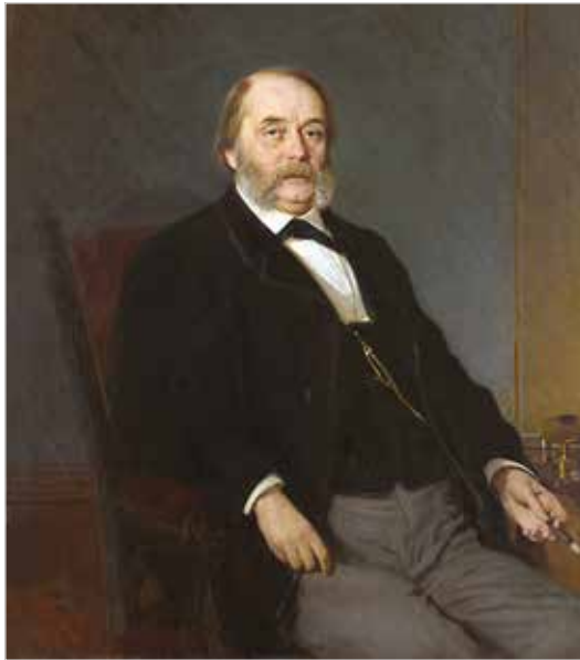
Портрет И.А.Гончарова. Худ. И.Н.Крамской, 1874 г.

Однако внимательный взгляд открывает совсем иное: романист строит свое творчество на глубокой религиозной основе. В этом смысле Гончарова можно сравнить только с двумя писателями в русской литературе: Н.В.Гоголем и Ф.М.Достоевским. Его творчество основано на идеале Христа, оно есть призыв к современному человеку — напрячь свои духовные силы и идти вслед Христа, попытаться стать «святым» — среди обыденности, а часто грязи и лжи современной жизни. Он писал о том, что знал по собственному опыту и к чему стремился лично. Драматическая борьба с собой, со своими страстями шла у него смолodu и не всегда заканчивалась победой, но он снова и снова возвращался к этой борьбе.