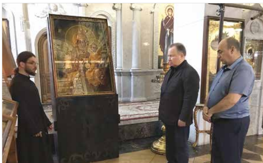
В Аланском Успенском мужском монастыре

В приветственном слове епископ Герасим отметил, что русская литература считается одной из величайших вершин мировой культуры, и в течение многих веков именно православие оказывало решающее влияние на формирование русского самосознания. По словам правящего архиерея, вплоть до