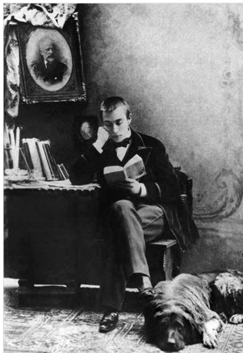
Сергей Рахманинов в юности

Рахманинов продолжил обучение в Московской консерватории в классе своего двоюродного брата Александра Зилоти. А затем изучал композицию под