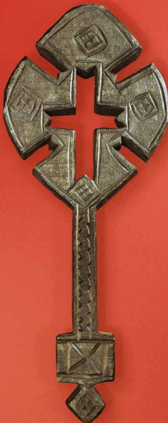
Богослужебный крест духовенства Эфиопской Церкви. XX в., дерево, естественные красители.

Из коллекции Международного Фонда духовного единства народов (МФДЕН)