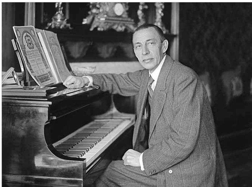
Сергей Рахманинов за роялем

Уже 28 июня 1941 года Рахманинов обратился с открытым письмом к русской эмиграции: «Независимо от отношения к большевизму и Сталину, истинные патриоты России должны помогать своей Отчизне одолеть агрессоров». В некоторых кругах его даже стали подозревать