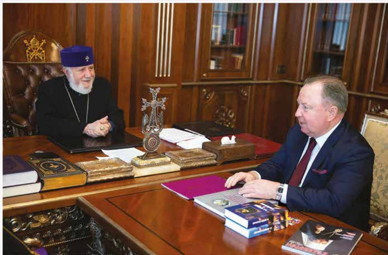
Встреча Президента Международного Фонда духовного единства народов (МФДЕН) профессора В.А.Алексеева с Его Святейшеством Верховным Патриархом и Католикосом всех армян Гарегином II. Эчмиадзин (Армения), 22 марта 2023 г.

В Государственной Думе Федерального Собрания Российской Федерации прошли XI Рождественские парламентские встречи в рамках XXXI Международных Рождественских образовательных чтений. Москва (Россия), 26 января 2023 г.