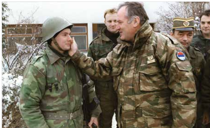
Ратко Младич с солдатами