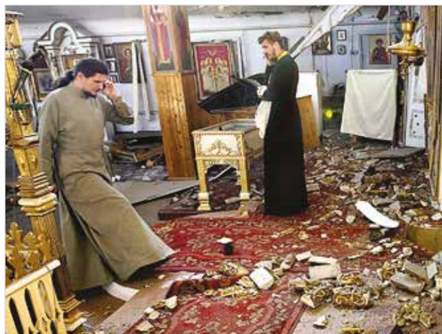
В разрушенном храме

Уничтожить каноническую Украинскую Православную Церковь невозможно, но маргинализировать ее в политическом поле украинская власть и ПЦУ очень хотят. Причина в том, что