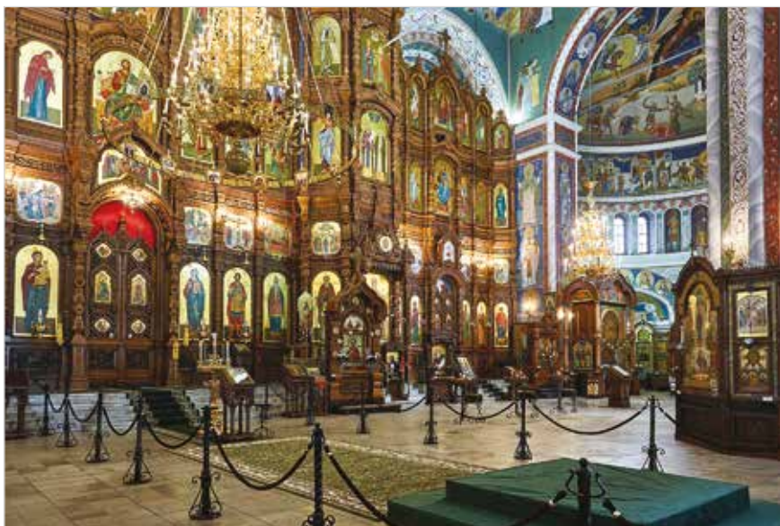
Александр-Невский собор. Внутреннее убранство

В 1991 году Благовещенский монастырь был возвращен Церкви, с 1993 года в нем возобновились богослужения.