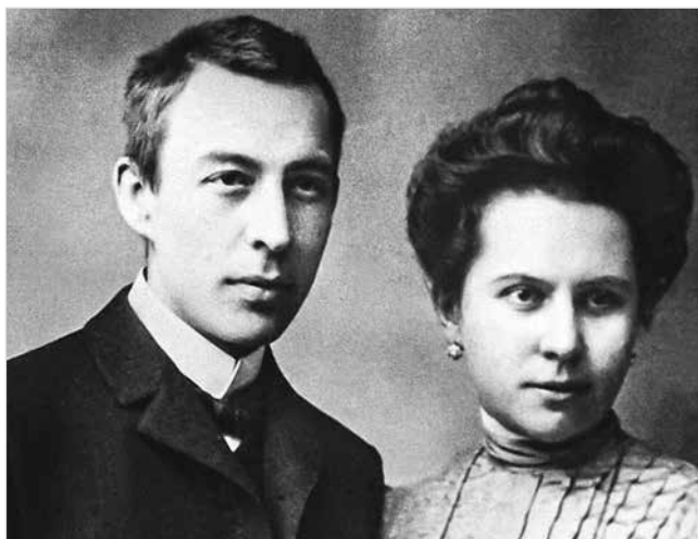
Сергей Рахманинов с супругой Натальей Александровной

руководством выдающихся композиторов Сергея Танеева и Антона Аренина. Дипломной работой стала одноактная опера «Алеко», за которую он получил Большую золотую медаль. Известный факт: Чайковский, принимавший экзамен у молодого композитора, поставил за оперу пятерку, окружив со всех сторон плюсами. И рекомендовал ее к постановке в Большом театре. Что вскоре и произошло — в 1893 году.