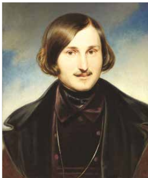
Портрет Н.В.Гоголя. Худ. Ф.Моллер, 1841 г.

В заключение святитель советует своим друзьям по отношению к религии заниматься единственно чтением святых отцов, «стяжавших очищение и просвещение, как и апостолы, и потом написавших свои книги, из коих светит чистая истина, и кои читателям сообщают вдохновение Святаго Духа».