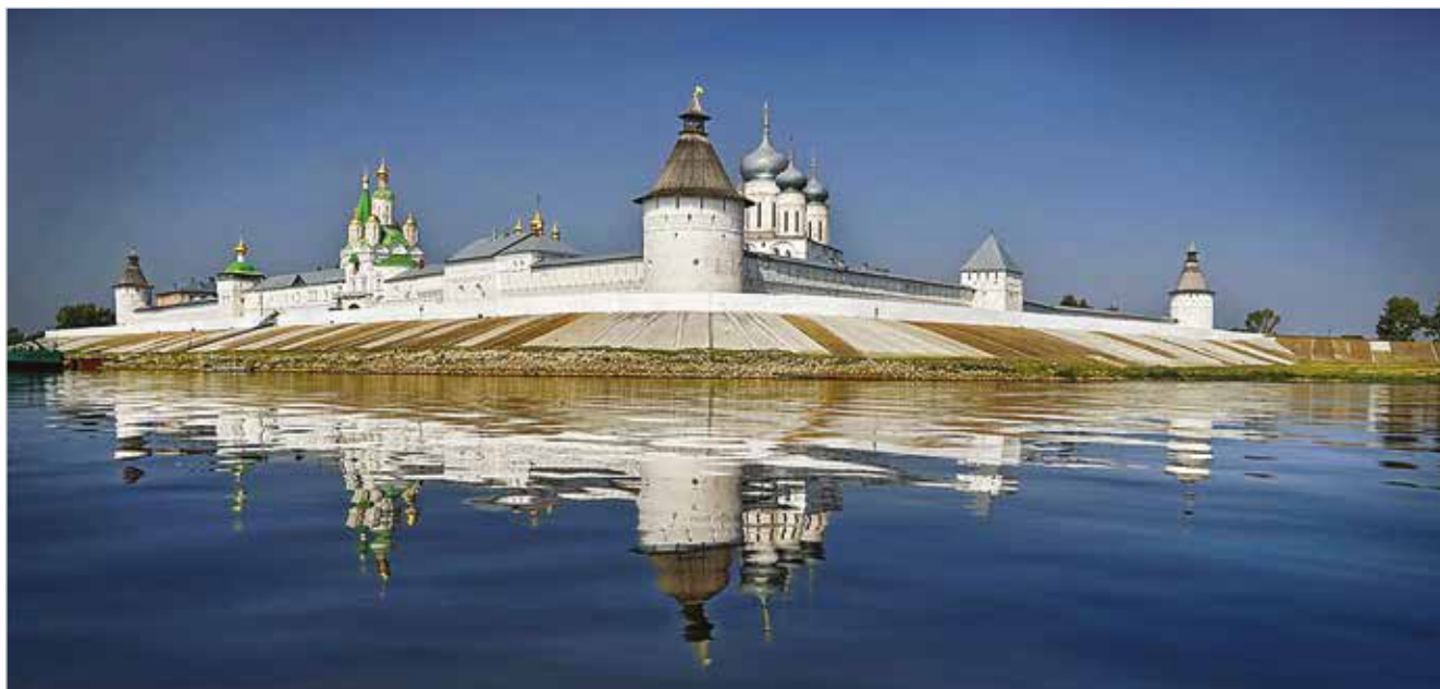
Свято-Троицкий Макарьевский Желтоводский монастырь

Не жаловались на нехватку покупателей и другие ярмарки, но разве сравнишь их с Макарьевской! Сюда товар везли со всей империи: из бурятской Кяхты — чай байховый, из Сибири — меха, от берегов Камчатки и далее, из Русской Америки, — китовый ус и моржовую кость, с низовьев Волги — икру и рыбу, от берегов Каспия — тюлений жир, с верховьев Волги сплавляли строевой лес, отправляли баржи с хлебом и солью. Торговля шла не на пуды и фунты — считали караванами барж! Павел Мельников-Печерский в романах «На горах» и «В лесах» не одну такую сделку описал «с натурой». Вот, например: