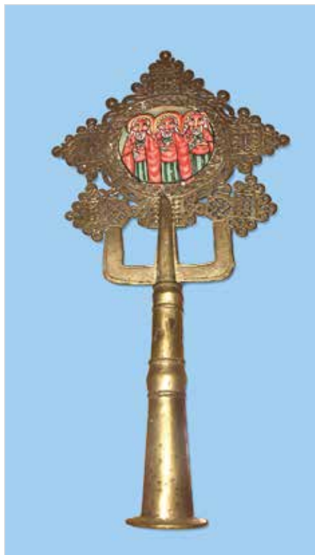
Навершие архиерейского жезла епископов Эфиопской Церкви (XIX в.). Из коллекции профессора В.А.Алексеева

Придя к власти, премьер-министр Ахмед Абий достиг больших успехов в объединении Церкви после возвращения патриарха Меркоревоса, который покинул страну после прихода к власти коммунистов в 1991 году и там назначил архиепископов в изгнании, которые были амхарами, открыто враждебными существующей власти и его многонациональной федеральной Конституции. После этого раскола многие считают, что вначале как бы молчаливая поддержка Абием отколовшегося духовенства сигнализировала Эфиопской Церкви о необходимости восстановления доверия и поддержки оромо. Помимо разногласий между оромо и амхара, многие тиграи осудили войну в Тиграе.