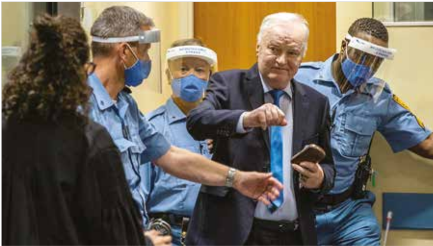
Ратко Младич в Гааге

стали называть «гитлеровским фашистом», в Загребе — убийцей сотен хорватов, Турция требовала его немедленной казни, в Австралии на ТВ говорили, что генерал, дескать, заставлял родителей есть своих детей.