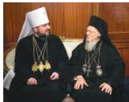
Патриарх Варфоломей с раскольником Думенко