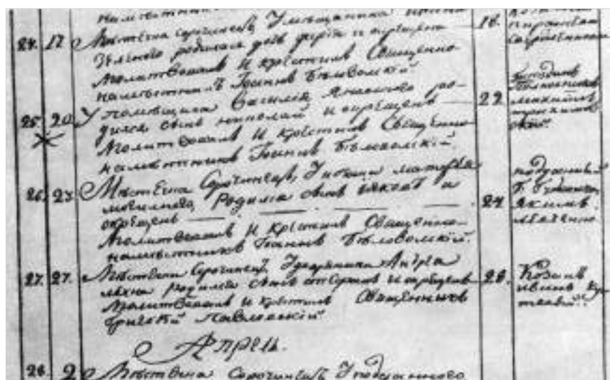
Метрическая запись о рождении Н.В.Гоголя

19 марта 1849 года Гоголь праздновал свое сорокале-