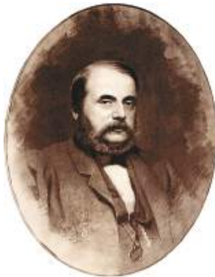
Иван Александрович Гончаров Портрет И.Н.Крамского

Однако тема счастья, даже семейного, не выдвигается русскими писателями на передний план. Австрийский писатель Стефан Цвейг видел в этом особенность русской классики: «Раскройте любую из пятидесяти тысяч книг, ежегодно производимых в Европе, О чем они говорят? О счастье. Женщина хочет мужа или некто хочет разбогатеть, стать могущественным и уважаемым. У Диккенса целью всех стремлений будет милый коттедж на лоне природы с веселой толпой детей, у Бальзака — замок с титулом пэра и миллионами... Кто из героев Достоевского стремится к этому? — Никто. Ни один».