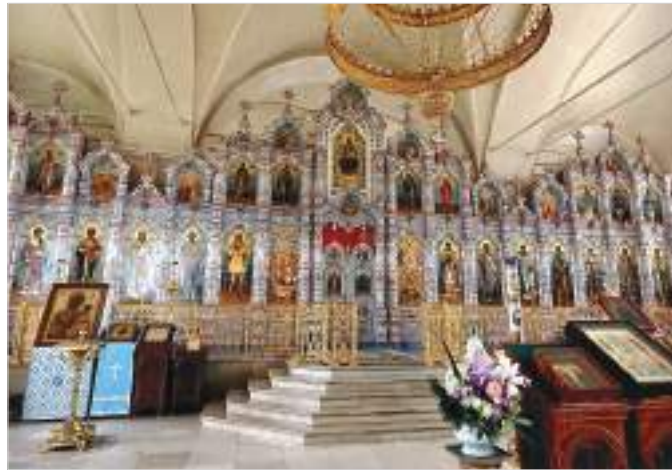
Фаянсовый иконостас в Успенском соборе