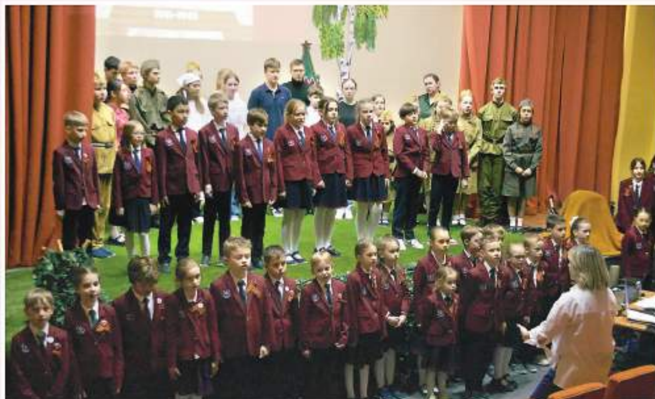
Праздничную театральную постановку «Мы из будущего», посвященную памяти событий Великой Отечественной войны, в преддверии празднования Дня Победы показали учащиеся и преподаватели Московской гимназии «Переделкино» Международного Фонда духовного единства народов. Москва, 8 мая 2024 г.

24 апреля 2024 года в Москве, в здании Международного Фонда духовного единства народов (МФДЕН), состоялось совместное расширенное заседание Президиума и Попечительского Совета (Годичное собрание) МФДЕН. На фото: участники Годичного собрания