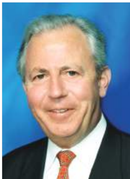
9-й Председатель Европейской комиссии Жак Сантер

В силу разных причин в 2000 году объединения христианства не произошло, но эта химерическая идея не канула в лету, хотя ушли из жизни многие ее вдохновители. Теперь готовится к воплощению этот мегапроект в 2025 году. Патриарх Варфоломей вместе с Папой Римским Франциском находятся во главе него. Дела у обоих обстоят не очень: Папа Римский погряз в ватиканских скандалах, патриарх Варфоломей не может справиться со своими церковными оппонентами в православном мире. «Хозяева свободного мира», т.е. лидеры стран Запада и США, недовольны обоими, но и у самих глобальная ситуация, что называется, вырывается из рук. Не так, как они задумали, идут дела в Европе, в самих США, на Украине, Ближнем Востоке, в отношениях с Китаем и Россией. Человечество, не нуждаясь в их усилиях, ищет путь к новому устройству мира, более справедливому и предсказуемому, которому не нужны хитроумные конспирологические проекты наподобие «Роковой даты — 2025», но стремятся к миру, основанному на спасительной высокой духовности и свободной воле народов.