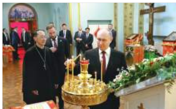
Президент РФ В.В.Путин в Покровском соборе в Харбине, 17 мая 2024 г.

Московский Патриархат развивает свое присутствие в духовной жизни современного Китая постепенно в рамках развития в целом российско-китайских отношений, не без помощи российских дипломатов, государственных органов, расширяя сеть своих приходов, как правило, на базе ранее построенных храмов, закрытых местными властями в прежний период. Одним из самых ярких примеров активизации русского православного присутствия в Китае явилось