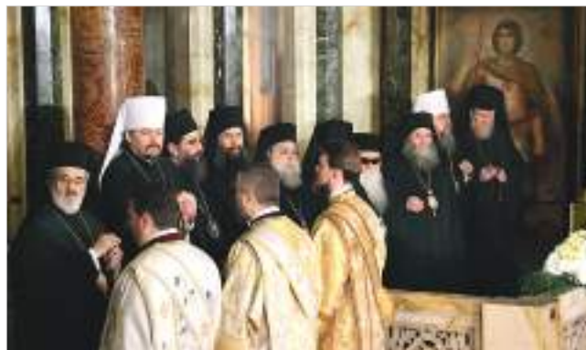
Зарубежные гости на прощании с почившим Патриархом Болгарским Неофитом

На самих погребальных церемониях в Софии патриарх Варфоломей в своей привычной манере опять не мог обойтись без скандальных выпадов. Болгары решили, что Божественную