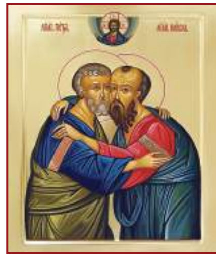
Икона святых апостолов Петра и Павла

Первая попытка в новейшей истории провозгласить первосвященника Константинопольского патриархата «всеправославным папой» в манер римских понтификов, стоящих во главе Ватикана, сорвалась в 2016 году,