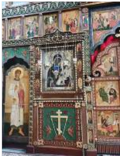
Икона с ниточкой от ризы Богородицы

Монахи рассказывают, что когда в 1989 году храм освятили вновь, купол и крест поставили за несколько часов до приезда архиерея. После того как храм освятили, наместник