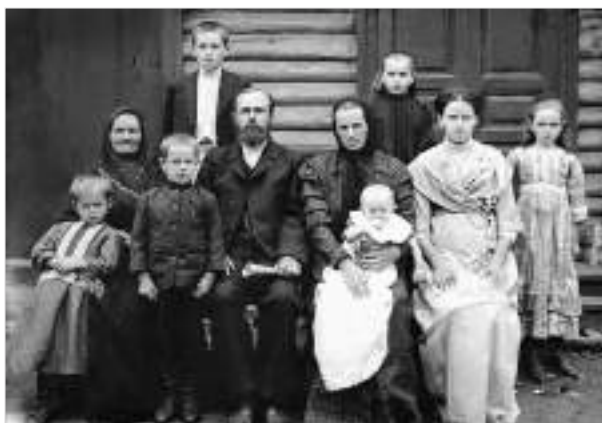
Русская многодетная семья. Россия, конец XIX в.

Несмотря на некоторое снижение «крутизны» подъема и спада обеих кривых за последние три года за счет государственных мер — маткапитала и других (военные потери в кривой смертности не учитываются), общая демографическая ситуация в стране остается катастрофической. По предварительной оценке Росстата в 2023 году суммарный коэффициент рождаемости в РФ снизился до 1,41–1,45. Это минимум с 2006 года. Напомним, для увеличения населения за счет рождаемости этот показатель должен превышать 2,17. До критически низких значений СКР опустился в Смоленской области — 1,13, Ленинградской — 1,04, Томской — 1,25. Недалеко ушли и другие «коренные» русские регионы. При этом в кавказских республиках тоже идет снижение рождаемости, но гораздо меньшими темпами. А это значит, что в ускоренном режиме вымирает именно русский народ. В прошлом году впервые за 200 лет на территории нынешней России родилось менее одного миллиона русских. При этом число женщин активного репродуктивного возраста сокращается на 2,2% каждый год. Это уже даже не «третий звонок», а настоящий набатный колокол! Русский крест поднялся во весь рост.