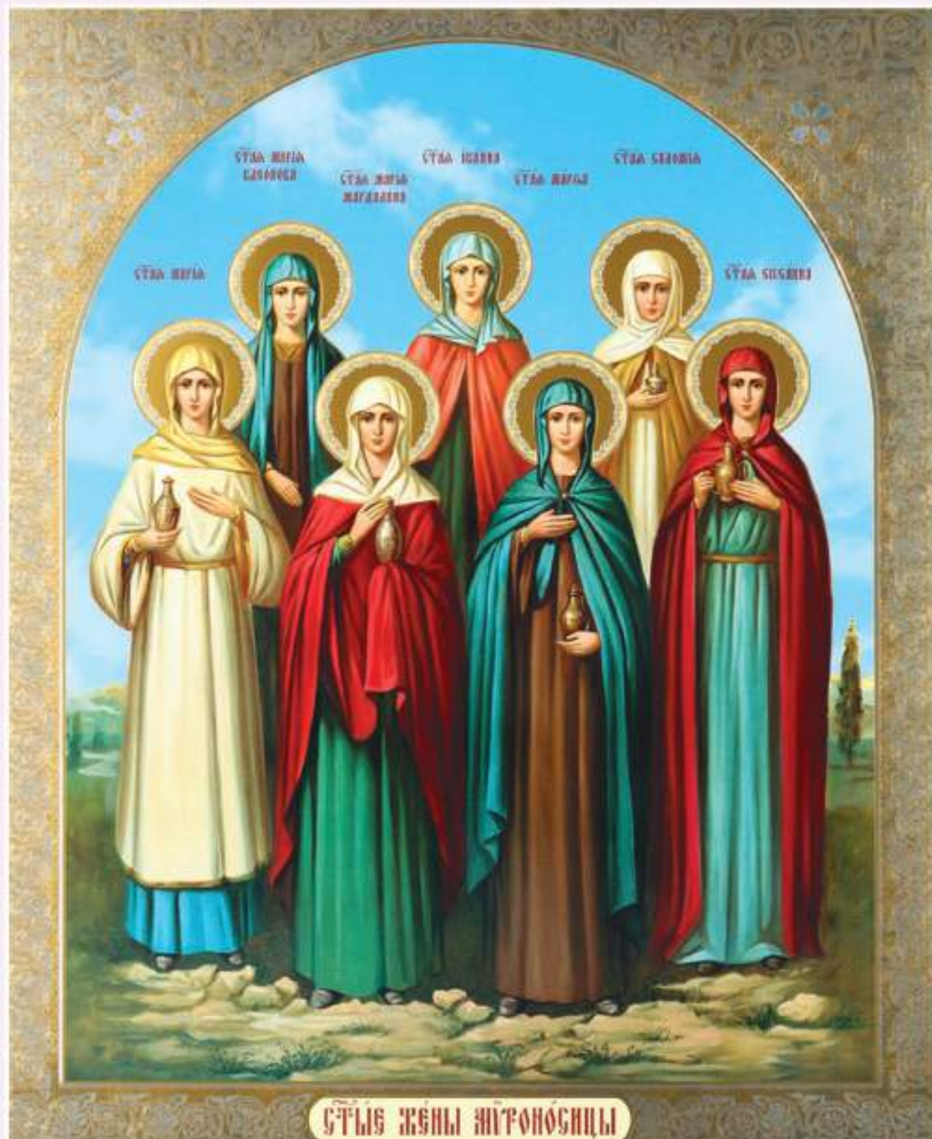
Жены-мироносицы. Икона XXI в.