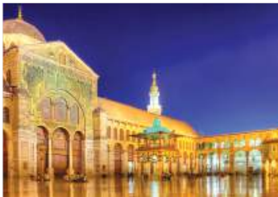
Мечеть Омейядов в Дамаске

В Касабе любят отдыхать семьями состоятельные люди из арабских стран Персидского залива. Здесь не жарко, не нужны кондиционеры, тихо и спокойно, чистый горный воздух, настоящий на соснах, есть небольшие кафе