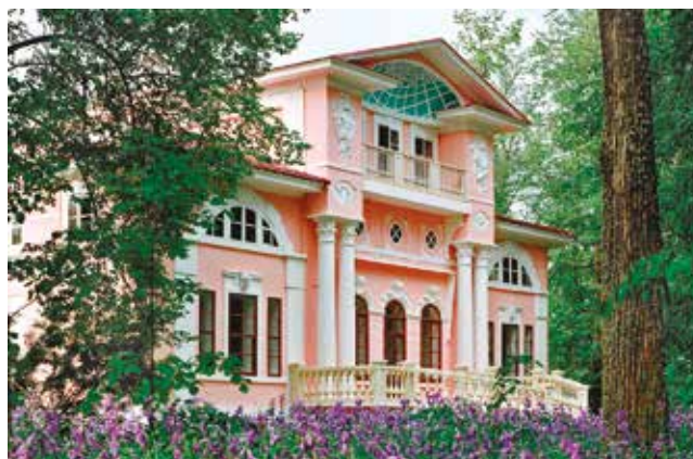
Усадьба в Покровском

Британский флот под командованием адмирала Чарльза Нейпира вошел в Балтийское море 14 апреля 1854 года. Адмиралтейство поторапливало командующего начать боевые действия рядом с Петербургом, и чтобы укрепить дух своих моряков, английскую эскадру в 17 вымпелов провожала в поход сама королева Виктория. Однако ни приказы адмиралтейства, ни присутствие самой королевы не заставили Нейпира начать действовать немедленно. В своих донесениях он каждый день ссылался на то, что Финский залив медленно очищается ото льда, но в действительности адмиралу мешал действовать не лед, а здравый смысл — путь к Петербургу лежал мимо Свеаборга и Кронштадта, которые при ближайшем рассмотрении оказались не такими «игрушечными», какими виделись из