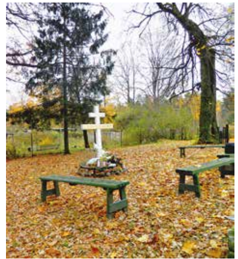
Место гибели священномученика Иоанна (Поммера)

В ночь с 11 на 12 октября 1934 года архиепископа Иоанна (Поммера) зверски убили на его даче на окраине Риги. Владыка принял мученическую