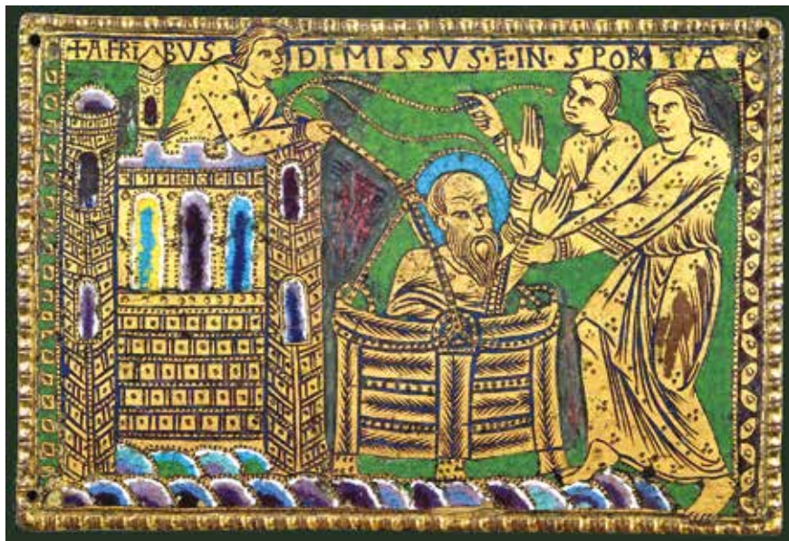
Икона «Спасение апостола Павла в Дамаске»

На месте базилики святого Захарии в Дамаске был возведен собор в честь его сына Иоанна Крестителя. В 635 году мусульмане взяли Дамаск, храм был разделен на две части — восточную, с православной часовней, и западную, где молились мусульмане. В 705 году халиф Валид конфисковал собор, где христиане и мусульмане молились бок о бок 70 лет, и начал сооружение мечети Омейядов. Взамен конфискованной части собора он возвратил христианам несколько церквей и разрешил построить новые. В том же 705 году здесь при разборке подземелий была обнаружена святая глава Иоанна Крестителя. Халиф Валид хотел убрать ее из мечети и сам начал копать землю, но когда дотронулся до святыни, оцепенел и не мог двинуться. Так реликвия осталась на месте, которое почитается сегодня и христианами, и мусульманами, ведь св. Иоанн Креститель в мусульманской традиции — пророк Яхья.