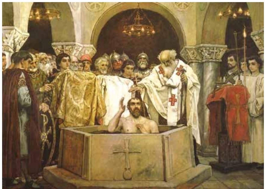
Крещение князя Владимира в Херсонесе Таврическом. Худ. В.Васнецов, 1896 г.

Иосиф Сталин в Ливадии в 1945 году соединил историческое время величия России — от начала до середины XX века, сакрально преодолев трагический разрыв между этими двумя хронологическими точками, тем самым закончив эпоху двух великих войн (некоторые утверждают, что это была одна война) ошеломительной побе-