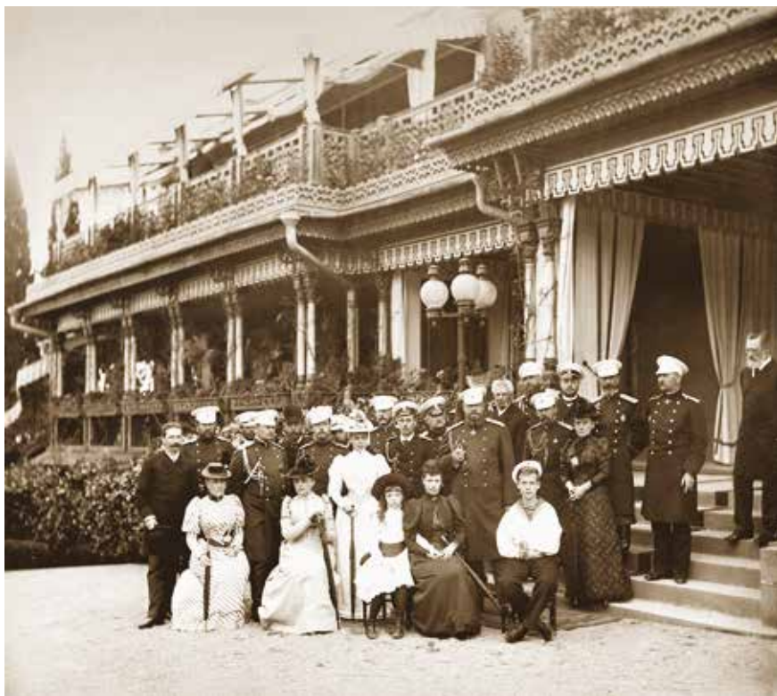
Император Александр III с семьей в Ливадии. 1891 г.

Политическая интернациональная группировка, пришедшая в результате отработан-