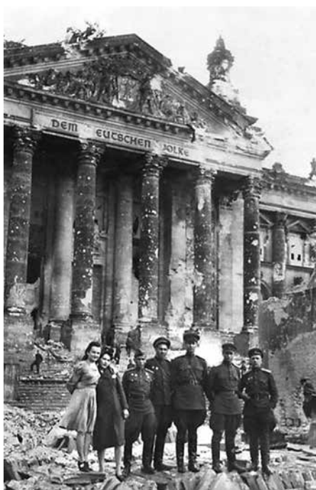
Советские воины-победители в Берлине

Логичным продолжением исследования эмоционального восприятия истории Второй мировой и Великой Отечественной войн стал вопрос о трактовке массового героизма. Ответы были удивительно искренними (только 14% не ответили на вопрос). В основном, студенты определяли массовый героизм как «великое чувство сопричастности общему горю и делу», бескорыстную преданность Родине, мужество, силу духа, долг и честь, «коллективный подвиг народа во имя своей Родины, семьи, истории, родного дома», «генетический код советских людей», «единение миллионов в деле спасения Родины (на фронте и в тылу)», «готовность сотен тысяч граждан жертвовать собственной жизнью за свою страну, свои идеалы, жизни соотечественников». Подобное восприятие массового героизма во время военных испытаний — залог прочности морально-психологического фундамента гражданской культуры молодежи, основа формирования поколения, ответственного за свою страну.