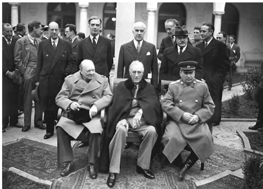
И.Сталин, Ф.Рузвельт и У.Черчилль на Ялтинской конференции. Февраль 1945 г.

Главным инструментом гармонизации международных отношений, который был создан в результате Ялтинских соглашений, стал уникальный институт — Организация Объединенных Наций с ее Советом Безопасности. Они и сегодня продолжают играть первостепенную роль в обеспечении цивилизованных отношений между странами и народами. Альтернативы ООН сегодня не существует, хотя с момента создания Организации прошло более 70 лет, что по современным меркам быстротекущего времени является огромным историческим достижением. Несмотря на многие попытки сломать ООН, Организация продолжает действовать. Это говорит