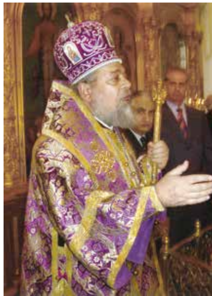
Митрополит Филиппопольский Нифон (Сайкали), представитель Патриарха Антиохийского и всего Востока при Патриархе Московском и всея Руси

Движимые «всечеловеческой отзывчивостью», как говорил Ф.М.Достоевский, Русская Православная Церковь и Правительство России в конце XIX века разрешали антиохийским священникам собирать милостыню и пожертвования на территории России, что нередко приносило Антиохийской Церкви большие средства. В 1908 году Синод Русской Православной Церкви принял специальное постановление, разрешающее принимать сирийцев и ливанцев в русские духовные семинарии и академии «на казенное содержание при условии рекомендации Антиохийского Патриарха». Неслучайно во многих православных храмах Ливана можно увидеть много икон, писанных в России, а рядом с алтарем — два высоких кресла, в которых восседали русский и греческий консулы во время богослужений.