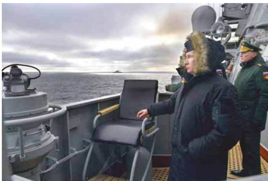
В.В.Путин на учениях российского Черноморского флота. Севастополь, январь 2020 г.

Для этого были задействованы огромные западноевропейские и американские финансовые и военные ресурсы, к власти в Киеве путем избирательных манипуляций было приведено антироссийское марionеточное правительство во главе с В.Зеленским, тупо подчиняющееся выпестованным американцами украинским нацистским и националистическим силам. Украинские нацисты, объявившие целью своей политики дерусификацию всей Украины (в которой около половины населения русскоговорящие) и создание комплексных угроз Москве, напичканные Западом и американцами самым современным оружием, должны были к весне 2022 года начать военные действия на Донбассе, втянув Россию в полномасштабную войну, против которой в защиту Киева должны были также выступить и войска НАТО.