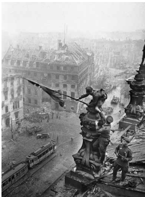
Советское Знамя Победы над Рейхстагом в Берлине

3. Русофобия: «мнимая боязнь гегемонии России, которая продемонстрировала ее господ-