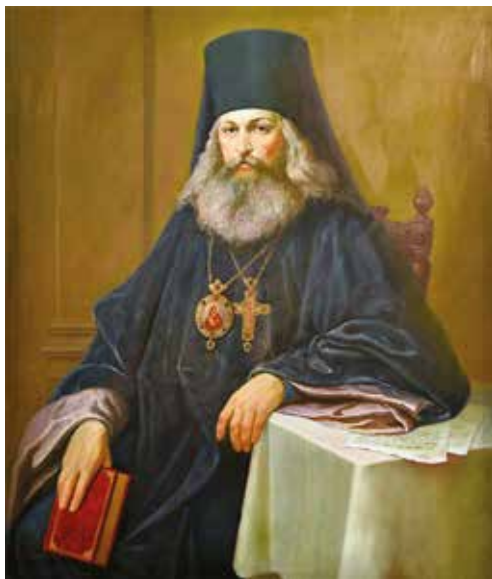
Святитель Игнатий (Брянчанинов)