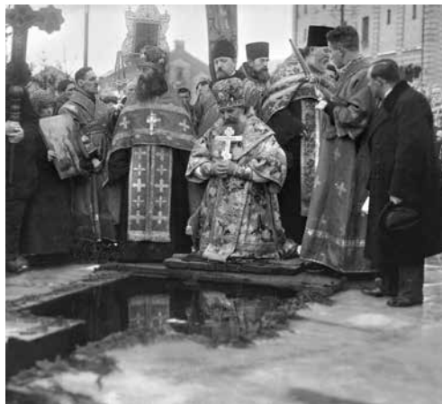
Священномученик Иоанн (Поммер) во время освящения воды в иордани

На момент его возвращения исторические условия на родине поменялись кардинально. Православная Церковь в Латвии переживала крайне тяжелые времена. В бедственном положении она оказалась уже во время Первой мировой войны. Значительная часть Латвии, включая Ригу, была оккупирована немецкими войсками. Еще до занятия немцами Риги наиболее ценное церковное имущество было вывезено вглубь России, эвакуированы духовные школы, часть православного духовенства покинула Латвию, в Россию выехала почти вся церковная администрация. Рижская епархия оказалась без епископа. Оккупационные власти отобрали у православных кафедральный собор, превратив его в немецкую гарнизонную лютеранскую кирху. Церковная утварь была вынесена, православные восьмиконечные кресты подшплены так, что стали четырехконечными. Для нужд католической части немецкого гарнизона забрали принадлежавший ранее Православной Церкви Алексеевский монастырь с епископскими апартаментами.