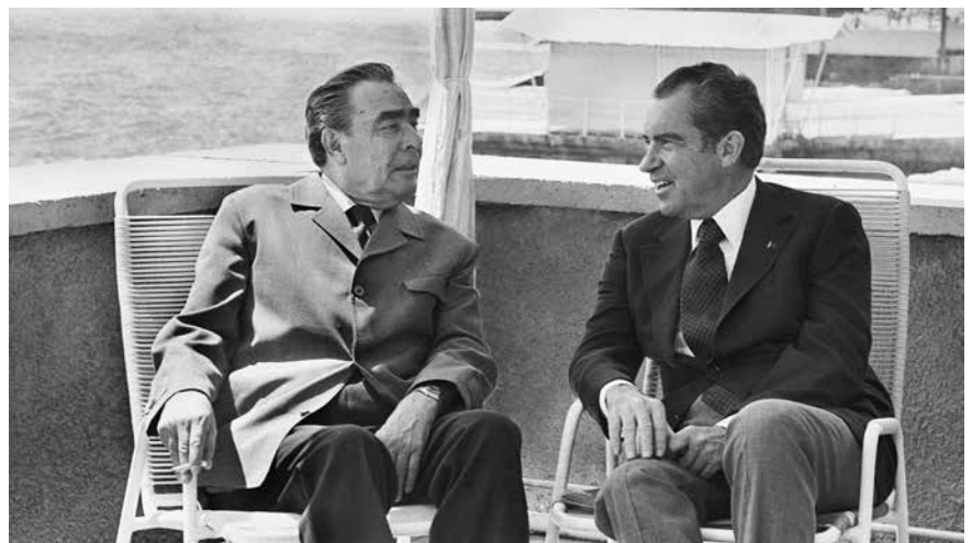
Л.И.Брежнев и Р.Никсон в Нижней Ореанде в Крыму. Август 1974 г.

С решительным возвращением России на Ближний Восток, с российского участия в сирийских событиях стала резко меняться конфигурация сил на глобальной международной арене, расклад стал складываться все больше в сторону Москвы. Не дав США к 2015 году уничтожить режим Асада в Сирии, Россия стала в значительной мере контролировать всю ближневосточную логистику и тем самым сильно потеснила американцев на Ближнем Востоке — одном из самых чувствительных регионов в мировой политике. Ближневосточный регион — это место, откуда поставляется для остального мира сверхважный объем критически значимых энергоресурсов — нефти и газа. Заняв решающее место в ближневосточном раскладе сил, отодвинув США, Россия, сама обладая огромными запасами нефти и газа, превратилась в ведущего игрока на мировом рынке энергоресурсов, создав мощную энергетическую сверхдержаву на планете. Таким образом, Москва показала, что сложившийся прежний мировой порядок нуждается в серьезных переменах. Без вхождения Крыма в состав России ей было бы очень