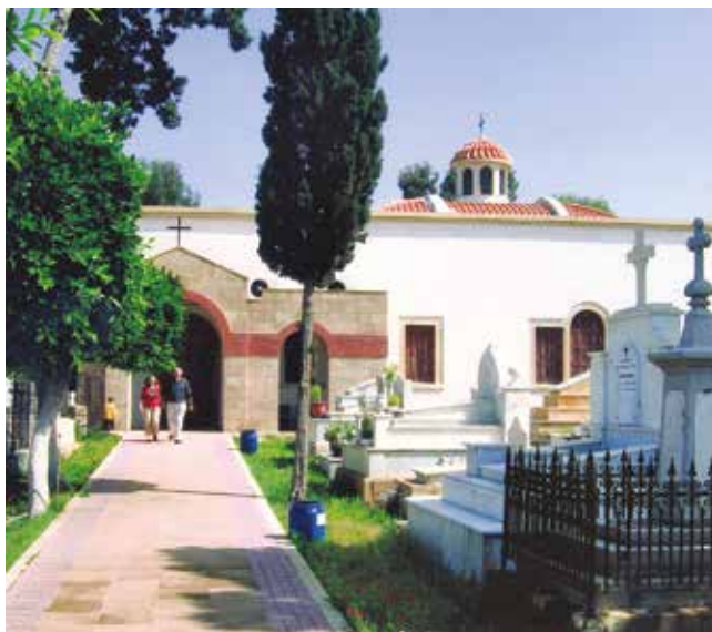
Храм Пророка и Крестителя Иоанна в Бейруте. Здесь служит представитель Русской Церкви при Патриархе Антиохийском. Вид со стороны кладбища, где есть могилы русских эмигрантов первой волны

Средиземное море в XVIII—XIX веках часто посещалось российскими военными судами. В 1768—1774 годах в Эгейском и Средиземном морях находилась мощная эскадра под командованием графа А. Орлова. В 1772 году русский фрегат помог египетскому паше Али Бейю снять осаду с города Сайды, осажденного турками и их союзниками. Затем русская флотилия подошла к Бейруту и потребовала контрибуции в размере годового сбора, который брала Турция с российских кораблей. После отказа был высажен десант, и турки уплатили контрибуцию. Эмир Юсеф Шехаб, союзник турок, дал обещание «впредь всякому российскому судну чинить послушание и в нужде вспоможение». На следующий год эмир Шехаб, рассорившись с турками, обратился с просьбой к командованию русского флота помочь освободить Бейрут от турецкого отряда, присланного из Дамаска. 25 мая 1773 года русская эскадра под командованием М. И. Войновича подошла к Бейруту. Осада продолжалась четыре месяца и завершилась благодаря действиям русских судов и десанта полной победой эмира Шехаба. Благодарный эмир выплатил 250 тыс. пиастров и направил 1 января 1774 года графу Орлову письмо, в котором сообщил о своем желании передать Ливан под протекторат России. В планы Российской империи не входили территориальные приобрете-