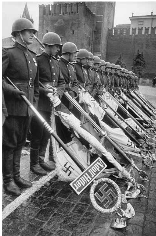
Парад Победы на Красной площади в Москве 24 июня 1945 года

Еще один исторический вопрос касался атомных бомбардировок Японии – нужно было назвать, когда и какие города подверглись атаке и авиацией какой страны были совершены налеты. Такая формулировка