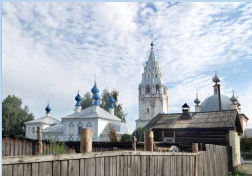
Собор Введения во Храм Пресвятой Богородицы. XVIII в.

самозванца Григория Отрепьева. Поэтому в Смутное время город оказался во власти поляков, но в результате восстания Галич сумел освободиться от интервентов. В 1609 году карательная экспедиция под командованием Лисовского сожгла город. Тогда население Галича частью было перебито, а частью ушло в леса. Позднее Галич принял активное участие в первом и втором ополчениях. Несколько десятилетий Галич с трудом оправлялся от нанесенного ему ущерба, чуть не превратился в обычное село, но удобное географическое положение на торговых путях помогло ему восстановиться.