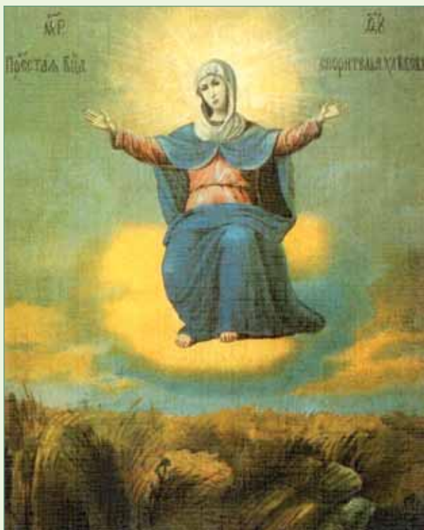
Икона Божией Матери «Спорительница хлебов». Бумага, открытка

«Спорительница хлебов» — икона с необычной, неизвестной ранее христианскому миру, иконографией. Исполненная глубокого духовного содержания, икона изображает Божию Матерь без Богомладенца над созревшей хлебной нивой, молящейся за Русскую землю. Внизу на узкой полоске земли — хлебное поле, часть которого уже сжата в снопы, лежащие тут же, а часть еще колосится среди цветов и травы. А над ним распростерла Свои руки в молитвенном жесте восседающая на легком облаке Божия Матерь в окружении круглой или овальной мандорлы, символизирующей Божественную Славу. Взгляд Ее, обращенный на нас, и милостивый, и одновременно строгий.