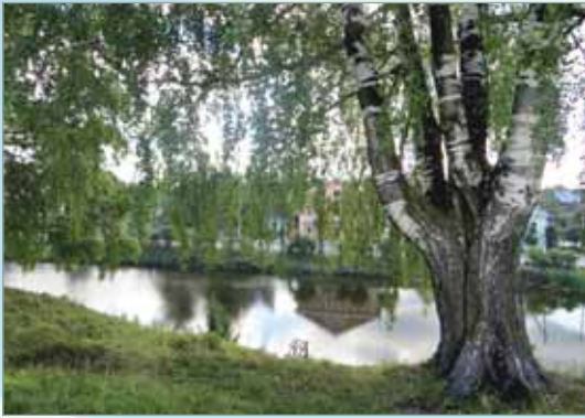
Остатки крепостных рвов у стен Галичской крепости