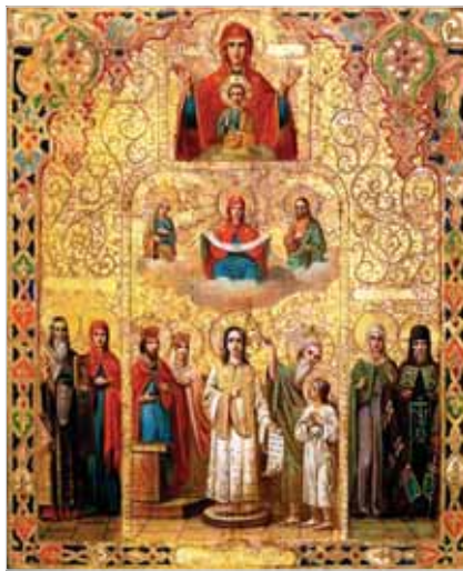
Икона Покрова Пресвятой Богородицы

Иоанна Рыльского в свою столицу Эстергом. Предание гласит, что местный римско-католический архиепископ не принял святыне мощи Иоанна Рыльского, за что был наказан и стал немым. После случившегося архиепископ долго молился перед мощами преподобного, прося прощения и исцеления. Просьбы его были услышаны, и венгерский архиепископ вновь обрел дар речи. В 1187 году, украсив ковчег, он с великими почестями отослал святыне мощи обратно.