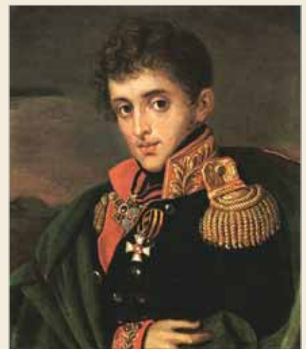
Портрет генерал-майора Александра Алексеевича Тучкова. Худ. Дж.Дюу

Сама она подолгу живет в небольшом домике на Бородинском поле. Всю себя отдает возведению на этом месте женского монастыря, посвященного памяти павших воинов. В 1840 году, на следующий день после пострига в мантию с именем Мария, она становится игуменией Спасо-Бородинского монастыря. Благодаря инициативе игумении Марии проводятся ежегодные Бородинские торжества, дабы упрочить память о героях-воинах в потомках, и устанавливается правило