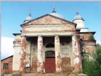
Бывший Николаевский Староторжский монастырь. Конец XIX — начало XX вв.

тически избежал регулярной перепланировки, проводившейся в XVIII веке (от нее, например, весьма пострадали Тверь и Новгород). Город сохранил в основном подворную систему, поскольку новая застройка в Галиче почти не велась и затронула только городские окраины. Это же обстоятельство способствовало тому, что в Галиче сохранились уникальные сооружения, имеющие важнейшее культурно-историческое значение.