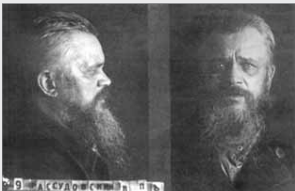
Фотография из следственного дела