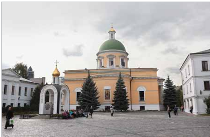
Троицкий собор Данилова монастыря