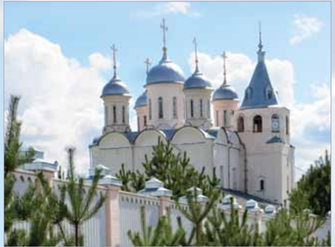
Свято-Успенский Паусиево-Галичский монастырь. XVII в.

В начале XV века во время так называемой Большой феодальной войны галичские князья выступали как соперники московского князя Василия Темного и некоторое время даже княжили в Москве, объединив