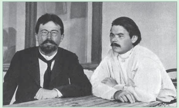
А.П.Чехов и А.М.Горький

Станиславский трудился над книгой «Моя жизнь в искусстве». Режиссер воспитал молодую смену учеников по собственной сценической системе, изложенной в рукописи «Работа актера над собой». Константин Сергеевич ушел из жизни в августе 1938 года. Руководство Художественным театром продолжил Владимир Иванович Немирович-Данченко. В 1942 году он обратился к постановке «Последние дни» М.А.Булгакова, в предчувствии своего ухода он сказал близким людям: «Холодище... Это везут Пушкина... Передохнуть и ехать дальше...»