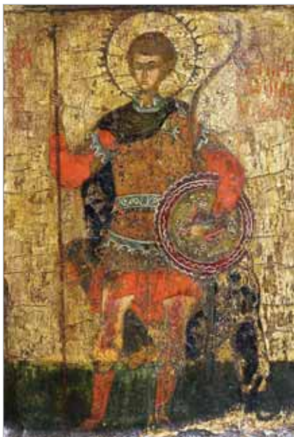
Икона великомученика Димитрия Солунского

В 1183 году во время очередного набега мадьяр их король Бела II захватил город Средец и вместе с другими ценностями взял святыне мощи