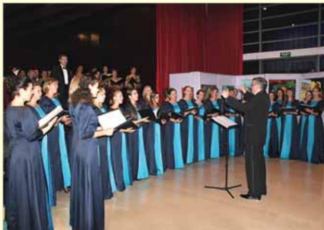
Выступление российских хоров в Российском культурном центре в Пекине