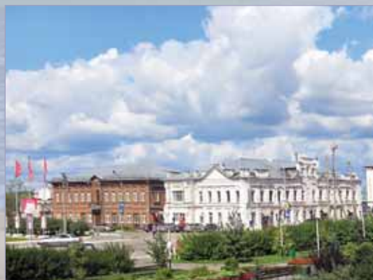
На улицах современного Галича

В истории Галича и его хозяйственной и социальной жизни всегда важную роль играла Церковь. Христианство начало проникать сюда еще с XI века, а полностью язычество было вытеснено в начале XIII века. Галичская земля была родиной четырех русских святых: святителя Филиппа, митрополита Московского и всея России, чудотворца; преподобных Павла Обнорского, Макария Унженского и Паисия Галичского. Всего в XVI–XVII веках в районе Галича насчитывалось 10 монастырей, но потом их число уменьшилось. До революции в Галичском уезде было два монастыря, 133 церкви и часовни, а в самом городе