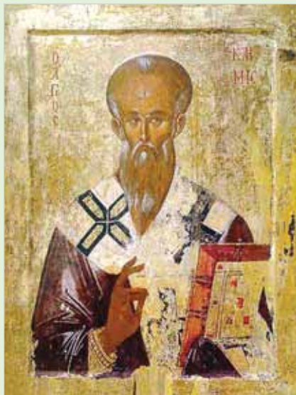
Равноапостольный Климент Охридский

Климент Охридский первым из болгарских иерархов стал служить, проповедовать и писать на славянском языке. Он трудился во славу Божию до глубокой старости, исполняя епископское служение и продолжая переводческую деятельность, и мирно отошел ко Господу в 916 году. Тело святого Климента было погребено