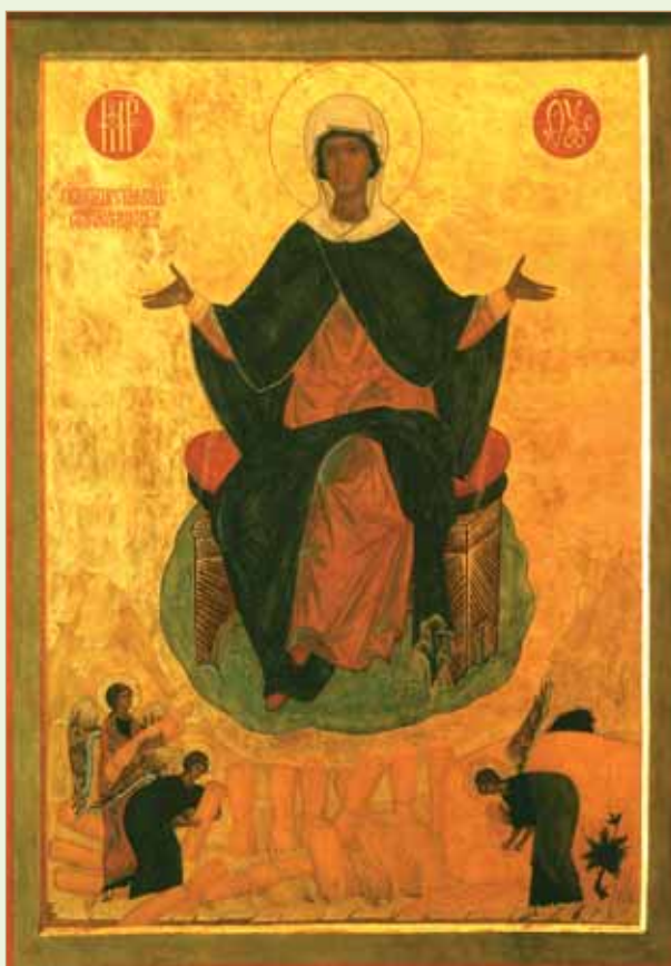
Икона Божией Матери «Спорительница хлебов». Новейшая иконография. Казанская Свято-Амвросиевская женская пустынь в Шамордино