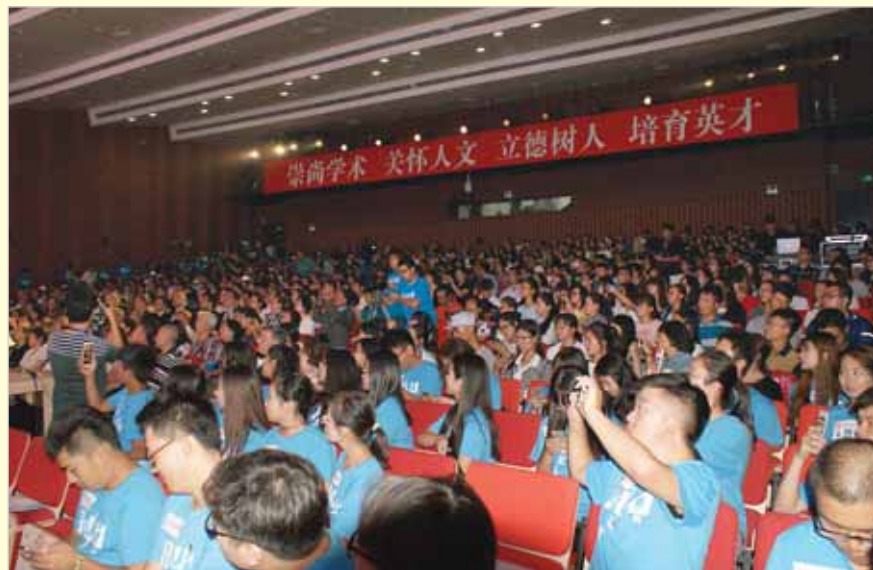
Китайская молодежь с восторгом слушала русские песни

Российский кинематограф с момента возникновения был связан с историческими процессами, происходящими в стране и в мире в целом. Многие киноленты получали мировые награды, такие как Премия Академии кинематографических искусств и наук («Оскар»), награды Каннского международного кинофестиваля. Классикой мирового кино стали фильмы «Броненосец «Потемкин» С.М.Эйзенштейна, «Веселые ребята» Г.В.Александрова, «Свинарка и пастух» И.А.Пырьева, «Война и мир» С.Ф.Бондарчука, «Летят журавли» М.К.Калатозова, «Солярис» А.А.Тарковского, «Москва слезам не верит» В.В.Меньшова, «Утомленные солнцем» Н.С.Михалкова.