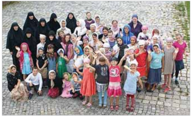
В летнем детском лагере для девочек

— Десять лет. Одновременно с открытием обители мы организовали на ее территории Марфо-Мариинский летний лагерь для девочек. На праздник любимой обители приехали юные участницы лагеря. Они порадовали нас замечательным концертом. Их звонкие голоса звучали под веселую гармонию. На ней играла