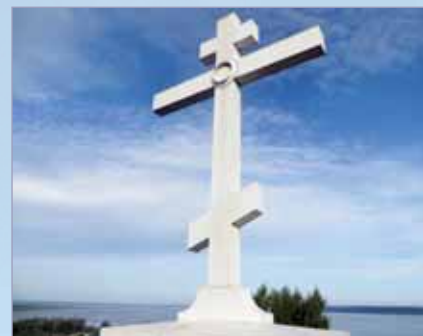
Галич. Православный крест на Балчуге в память о героической защите города в 1609 году

По указу Петра I в 1709 году Галич вместе с другими северо-восточными городами отошел к Архангелогородской губернии. После учреждения в 1778 году Костромского наместничества, а затем губернии стал уездным городом и получил свой герб: в червленом поле воинская арматура с выходящим из нее крестом Иоанна Крестителя. С этого времени меняется облик города, поскольку он стал застраиваться согласно новому регулярному плану. В первой половине XIX века в городе появляются первые промышленные предприятия. После революции 1917 года Галич продолжает развиваться как один из крупных промышленных центров края. На базе дореволюционных предприятий и созданных в 1920–30-х годах производственных артелей возникли многие