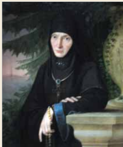
Маргарита Михайловна Тучкова. Неизвестный художник, 1840-е годы

Первое, что вспоминается, когда слышишь имя Маргариты Михайловны Тучковой, — это Бородинское поле, десятки тысяч павших воинов, где, по воспоминаниям Федора Николаевича Глинки, «лежали трупы,