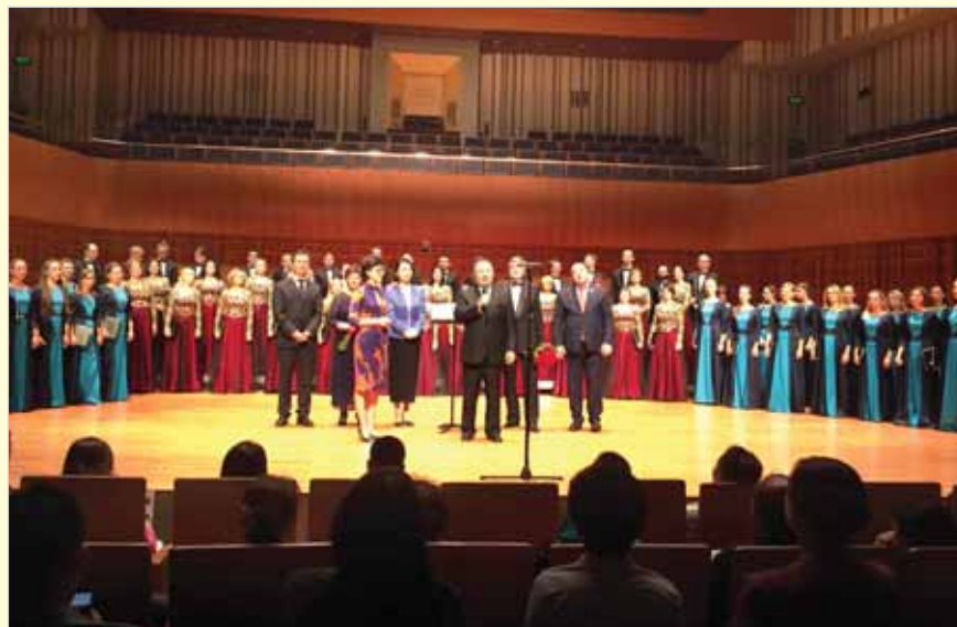
Завершение программы «Голоса музыкальной России в Китае». Сиань, 15 сентября 2016 г.

13 сентября концерт российских коллективов состоялся в Большом зале Пекинского объединенного университета – одного из крупнейших вузов страны. Университет был создан после завершения «культурной революции» с целью скорейшего обучения тысяч молодых людей, лишенных возможности учиться в течение целого десятилетия. Сегодня в корпусах университета общей площадью 600 тыс. кв. м учатся около 30 тысяч студентов; помимо двух с полови-