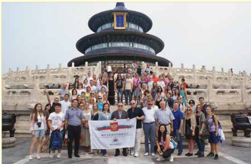
Участники программы Фонда «Голоса музыкальной России в Китае». Пекин, Храм Неба, 12 сентября 2016 г.

ной миллионов книг и учебных пособий, имеющих в библиотеке, университет располагает самыми современными электронными средствами обучения, лабораториями и тренажерами. В концерте также приняли участие китайские исполнители — преподаватели и студенты университета, исполнившие как современные музыкальные композиции, так и древние мелодии времен танской династии.