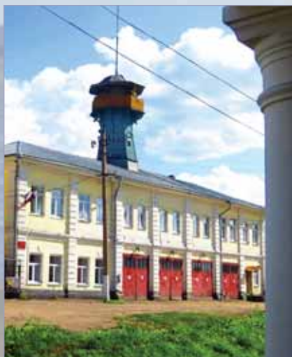
Галич. Старинное пожарное депо. XIX в.

В конце концов Галич, оказавшись в центре страны, потерял свое оборонное значение, но постепенно окреп экономически, поскольку через него шла торговля с Сибирью; Галич торговал с Архангельском, Вяткой и Москвой, а позднее и с Санкт-Петербургом. Отсюда шла торговля мехами с Западной Европой и Азией, также была развита торговля рыбой.