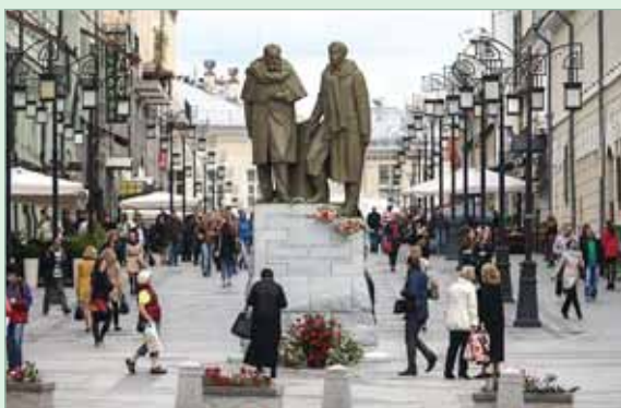
Памятник основателям театра в Камергерском переулке, открытый в сентябре 2014 года