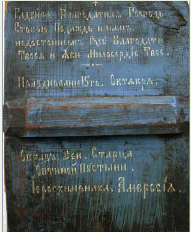
Икона Божией Матери «Спорительница хлебов». Передана в скит, в келью старца Амвросия в 1999 году

жался в Шамордине, по особенному Промыслению Божию; а почему — это должно означиться после». Предчувствуя свою кончину, благодатный слабеющий старец все силы свои отдает созданной им обители, претерпевая большие труды и скорби. О своей душевной скорби старец иногда высказывался косвенно, намеками, а иногда и так, в присутствии сестер: «Матери и сестры! Я у вас здесь на кресте».