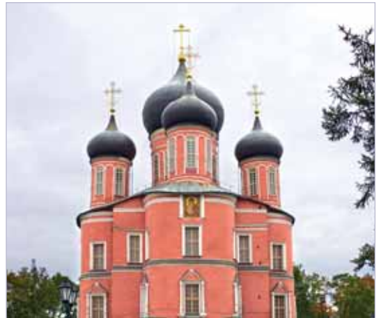
Большой Собор Донского монастыря

рой пел архимандрит Григорий (Лебедев), позже ставший настоятелем Александро-Невской Лавры и позже архиереем. Я его очень полюбил, и он меня тоже. Вот он-то и обратил внимание на мой голос и отдал в обучение к игумену Алексею, бывшему в монастыре регентом. Науку отца Алексея, который учил меня гласам и славянскому языку, я освоил