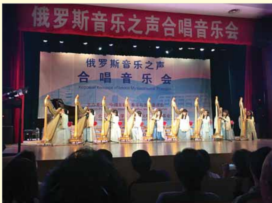
Выступление китайских музыкантов в Пекинском объединенном университете

В Российском центре в Пекине проводится множество интересных и разноплановых мероприятий, способствующих углублению взаимопонимания и укрепления дружбы между народами России и Китая. Среди них – выступления известных российских и китайских художественных коллективов и деятелей культуры, презентации научно-технического, экономического и инвестиционного потенциала различных регионов Российской Федерации, многочисленные форумы, «круглые столы», лекции, семинары, встречи молодежи двух стран, художественные и фотовыставки, кинопросмотры, концерты классической и современной музыки, спектакли, литературные и поэтические вечера.