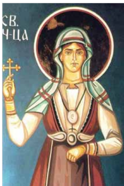
Икона святой Параскевы (Петки)

Православной Церкви праздник Покрова Пресвятой Владычицы нашей Богородицы и Приснодевы Марии установлен с XII века. И, что характерно, этот праздник отмечают только в славянских странах.