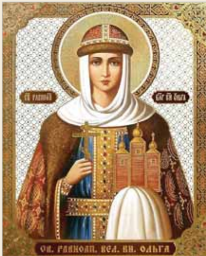
Равноапостольная княгиня Ольга