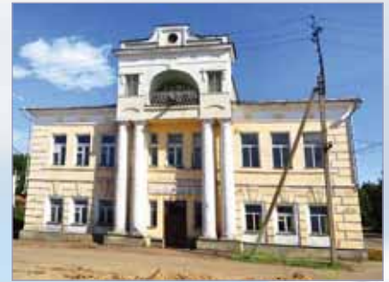
Один из трех уцелевших представительных домов. Построен после 1812 года, предположительно французами