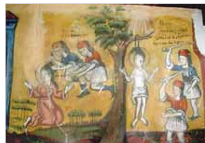
Из жития великомученицы Златы

иначе она будет наказана. Ее семья просила, чтобы она подчинилась ему. Но Злата с юности отличалась необычайной силой характера, целомудрием, красотой и твердой верой во Христа. И как ни старался местный турок прельстить девушку и заставить ее принять ислам, ни уговоры, ни угрозы, продолжавшиеся в течение многих месяцев, не сломили духа славной исповедницы Христовой. И тогда ее стали мучить, она претерпела чудовищные пытки, после чего турки ее повесили, нарезали тело на куски и разбросали. Это случилось 18 октября 1795 года. В этот день чтит ее память Болгарская Православная Церковь, а Греческая, Сербская и Румынская Православные Церкви чтут ее память 13 октября. На иконах святую Злату часто изображают в болгарской национальной одежде.