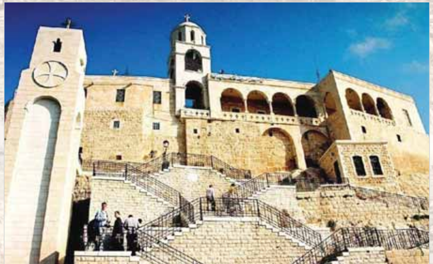
Сайднайский женский монастырь в честь Рождества Пресвятой Богородицы

Тысячи паломников со всего света посещают это святое место