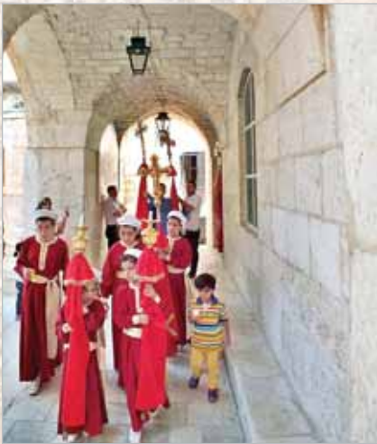
Крестный ход в монастыре

В этот момент монах понял, что именно он является причиной такого бедствия, и решил от-