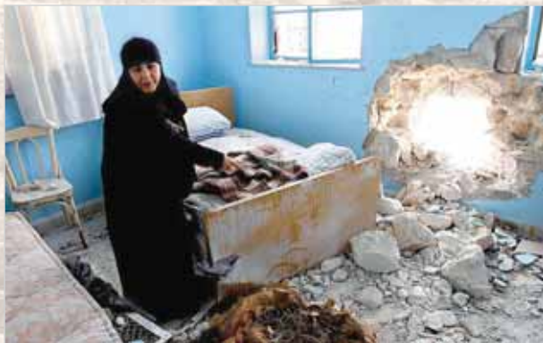
Мать Верона — настоятельница монастыря Херувимов — в келье, куда попал снаряд боевиков