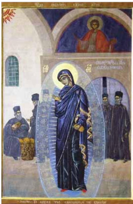
Светописанный образ Пресвятой Богородицы

Особо необходимо отметить и празднование в честь явления Светописанного образа Пресвятой Богородицы. Праздник этот окружен таким почитанием среди братии, что со времени своего учреждения в 2003 году возрос до степени полноценного монастырского панигира. По благословению отца Иеремии в монастыре написаны иконы, составлена служба, освящен храм в честь Светописанного образа и построена часовня на месте явления Божией Матери. В самый день праздника по окончании Литургии сюда совершается торжественный крестный ход и служитя водосвятный молебен. В 2014 году произошло чудо: был обретен сам подлинный негатив Светописанного образа — фотографии, зафиксиро-