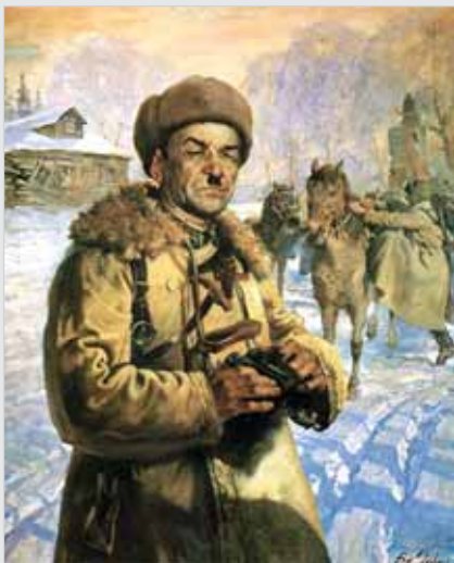
«Портрет Героя Советского Союза генерал-майора И.В.Панфилова». Худ. В.Н.Яковлев, 1942 год

Вследствие вероломного нападения фашистской Германии на Советский Союз в первые месяцы войны мы терпели колоссальные поражения несмотря на то, что Красная Армия и Флот героически сражались с превосходящими силами врага. Но грозный вал фашистских армий продолжал катиться по нашей территории на восток.