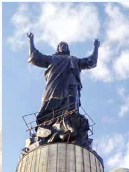
Образ Христа на горе Херувимов. Скульптор Артузи Папоян (Армения)

По пути ему попалась газель, которую император начал преследовать в надежде, что она приве-