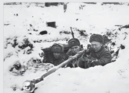
Красноармейские боевые расчеты на позициях во время Битвы за Москву. Зима 1941 года

стоялись похороны зверски замученных гитлеровцами советских воинов. В похоронах приняли участие жители деревни Строково и весь личный состав 129-й отдельной стрелковой бригады. Их подвиг был высоко оценен Правительством Советского Союза. Они были награждены орденом Ленина (посмертно). (ЦАМО РФ, ф. 208, оп. 2524, д. 13, л. 31).