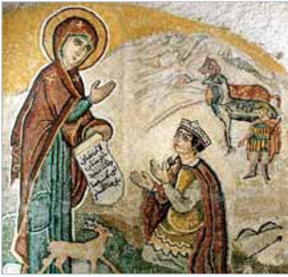
Явление Пресвятой Богородицы императору Юстиниану Великому. Мозаика

себя. Не заходя в Сайднайский монастырь, он решил сразу отправиться в Египет. Но только он взошел на корабль, поднялся такой сильный ветер и шторм, что невозможно было даже поставить парус и казалось, что судно вот-вот пойдет ко дну.