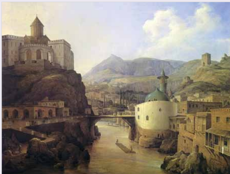
Тифлис. Худ. Н.Г.Чернецов. 1839 г.