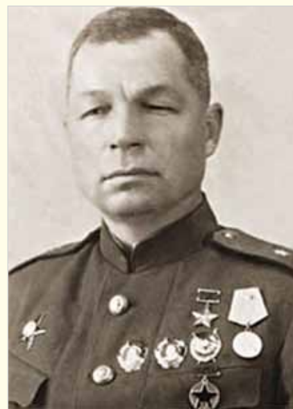
Герой Советского Союза генерал-майор Николай Павлович Симоняк (1901–1956)