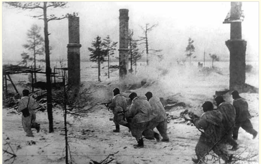
Бойцы Волховского фронта в наступлении во время прорыва блокады Ленинграда. Январь, 1943 г.