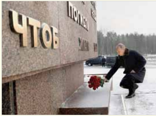
Президент России В.В.Путин возлагает цветы к памятнику «Рубежный камень» военно-исторического комплекса «Невский пятачок». 18 января 2018 г.

16 января батальоны 269-го и 270-го полков дивизии Н.П.Симоняка ворвались в Рабочий