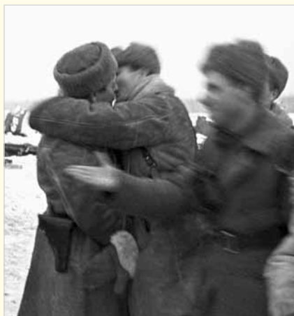
Встреча воинов 2-й Ударной и 67-й армий. 18 января 1943 г.

бомбовые удары были слышны за десятков километров вокруг.