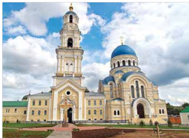
Свято-Успенская Тихонова пустынь. Современный вид

а мы в котловане... Один из братии, услышав наши сетования на беспощадное солнце, произнес: «Это еще не жара. Вот в преисподней — там будет пекло!»