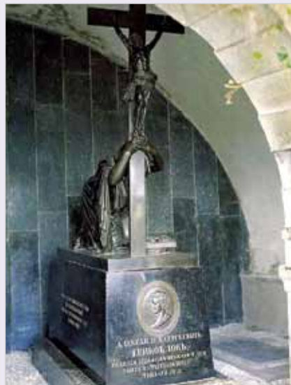
Могила А.С.Грибоедова в некрополе в Тбилиси

толпа. Не властные над душой, бесновались, кричали, терзали мертвую плоть. Наконец, будто устав, сбросили в ров, где уже ждал русского посланника его верный конвой: так, должно быть, и отбыл он на небо — воин Христов в окружении своей дружины.