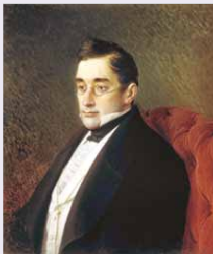
Портрет А.С.Грибоедова работы И.Н.Крамского, 1873 г.

«Ум и дела твои бессмертны в памяти русской, но зачем пережила тебя любовь моя?» — слова его юной вдовы, начертанные на грибоедовском надгробье.