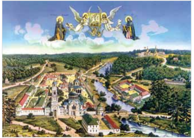
Свято-Успенская Тихонова пустынь. XIX в.