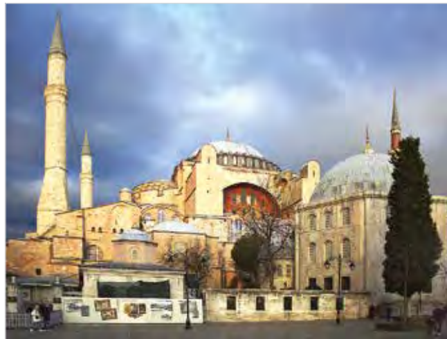
Собор Святой Софии в Стамбуле (с 2020 года — мечеть)

После заседаний в честь участников конференции был дан обед от имени руководства Фонда, на котором присутствующие тепло поблагодарили Президента МФДЕН