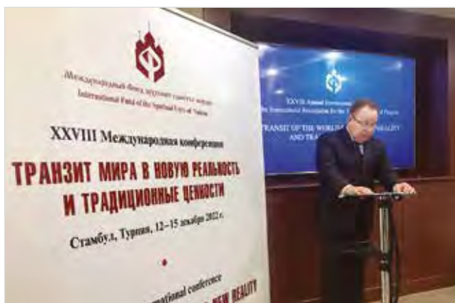
Доклад Президента Фонда профессора В.А.Алексеева по основной теме конференции

На конференции отмечалось, что мир стремительно движется в сторону фундаментальных изменений, уходит от сложившейся модели американцентризма и евро-атлантизма и направляется в сторону нестабильной неопределенности. С тревогой говорилось, что в настоящее время в мире существует более ста локальных, региональных и более крупных вооруженных конфликтов, которые в совокупности могут свидетельствовать об уже идущей большой войне, по словам Папы Римского Франциска, «третьей мировой войне».