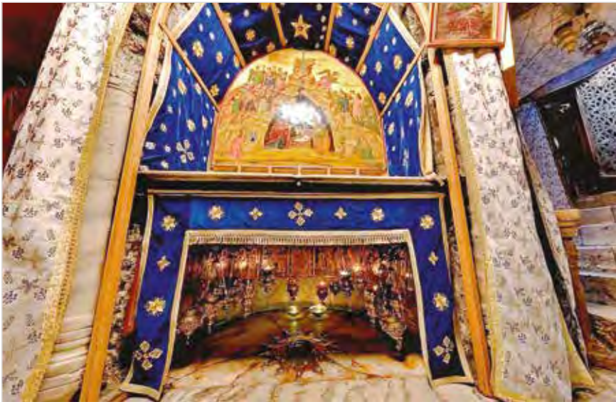
Вифлеем. Место рождения Иисуса Христа

Самый значительный памятник современной Иордании — развалины Петра, столицы арабского царства набатеев. Греческие географы Страбон, Диодор и Птолемей называли эту область Набатеями или Аравией Петрейской и описывали ее столицу как расположенную на высокой, труднодоступной скале. Отсюда и название — Петра, то есть «Камень». Интерес к этому району проявляли многие ученые и путешественники. Петру в начале XIX века искал немецкий ученый У. Зеецен. Он почти дошел до нее, однако не смог найти туда проводника. Заслуга открытия Петра в 1812 году принадлежит известному швейцарскому востоковеду Йоганну Людвигу Буркхардту. За время своих путешествий по Аравии он сделал немало открытий, но посещение Петра было самым сенсационным.