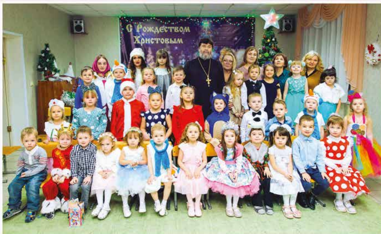
Праздничный утренник, посвященный Рождеству Христову, в Детско-юношеском Центре духовного воспитания и развития Международного Фонда духовного единства народов (АНО «ДЮЦ ДВР МФДЕН»). Ульяновск (Россия), январь 2023 г.