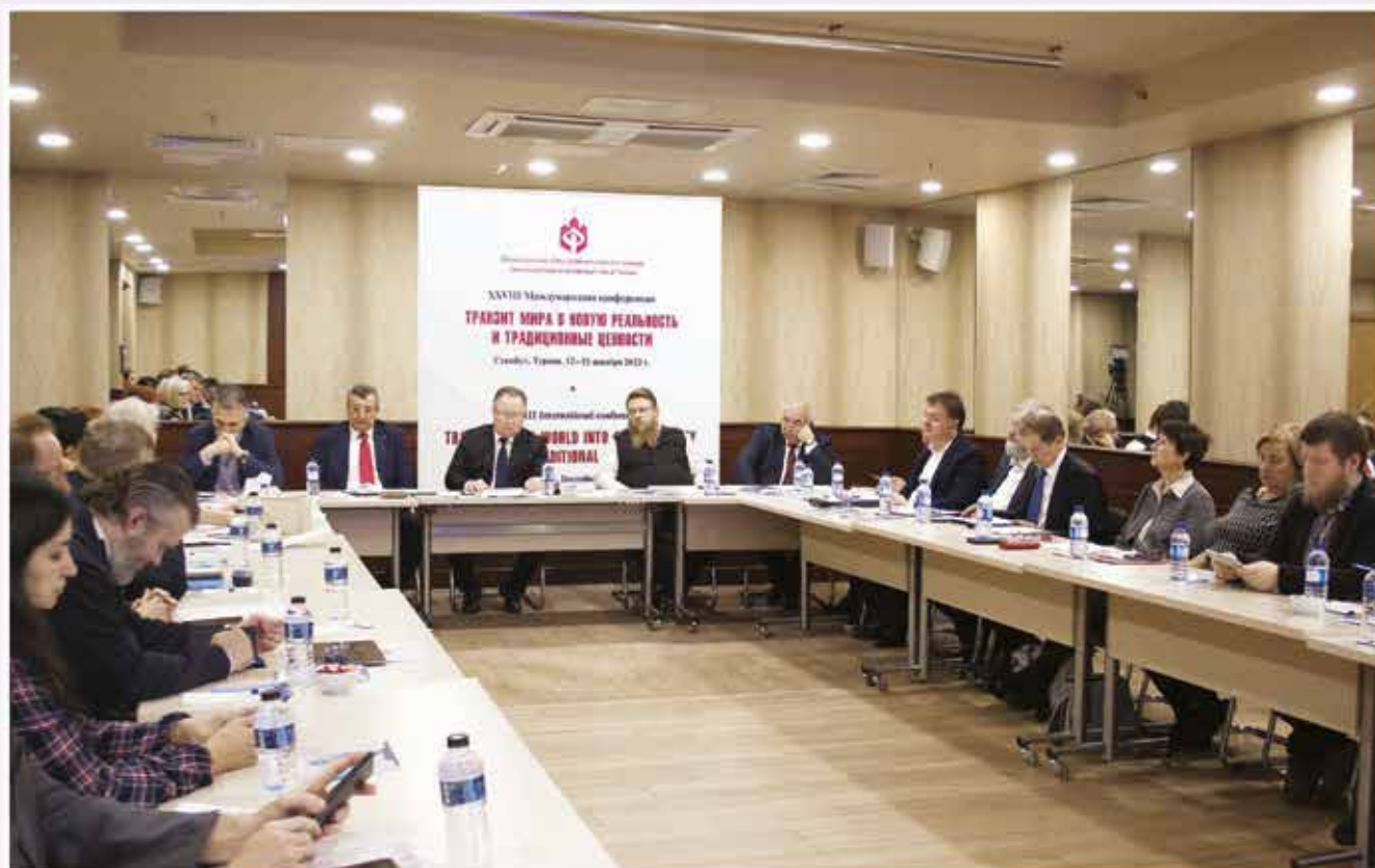
С 12 по 15 декабря 2022 года в Стамбуле (Турция) прошла XXVIII ежегодная Международная конференция Международного Фонда духовного единства народов (МФДЕН) на тему «ТРАНЗИТ МИРА В НОВУЮ РЕАЛЬНОСТЬ И ТРАДИЦИОННЫЕ ЦЕННОСТИ». На фото: участники конференции