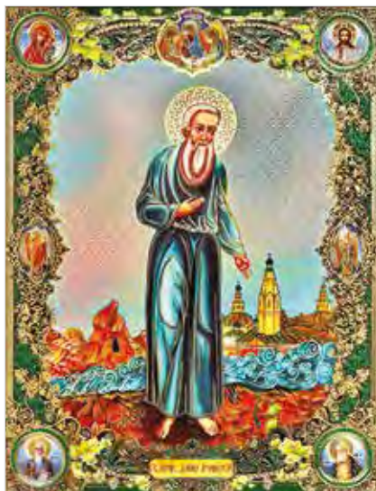
Святой праведный Даниил Ачинский

Старец родился в Малороссии. Участвовал в Отечественной войне 1812 года, во время которой был ранен. После войны выучился грамоте и стал читать Священное Писание и жития святых. Повествования об угодниках Божиих произвели на него такое сильное впечатление, что он решил оставить службу и уйти в монастырь или