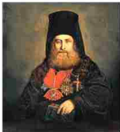
Архиепископ Херсонский и Таврический Игнатий

В письмах Муравьеву святитель Игнатий давал духовные советы и наставлял, приводя в пример события из Библии и русской истории. «Развивайте в русских войнах живущую в них мысль, что они, принося жизнь свою в жертву Отечеству, приносят ее в жертву Богу и сопричисляются к святому сонму мучеников Христовых. Гораздо вернее идти на штыки с молитвою, нежели с песнею: песнь приносит самозабвение и прилична римляну; а молитва доставляет воодушевление и прилична благочестивому христианину», — писал он Муравьеву. — Христианская вера порождает героев, скалала герой Суворов, — и постоянных героев, а не минутных. Российская история представляет единственный пример Христианского мученичества: многие