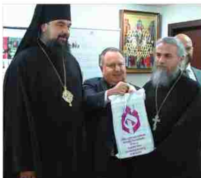
Благодарное дарение библиотекам Республики Азербайджан и православным приходом Бакинской и Азербайджанской епархии Московского Патриархата 12-томной книжной коллекции «Русские писатели-классики и православие»