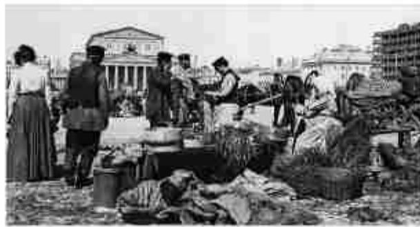
Москва, XIX в.

Таким образом, Гончаров показывает, что в стране в настоящий момент нет «слитности сил и элементов». Тем не менее,