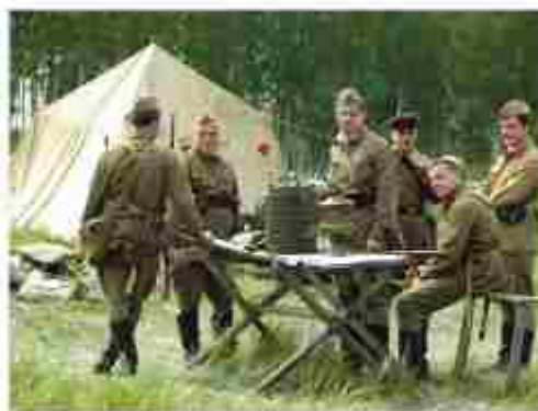
Многим интересно погрузиться в историю, 2024 г.

Вот какие мысли возникают у меня, у моих друзей, свер-