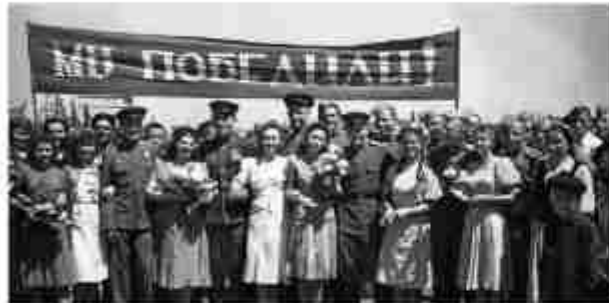
Народ празднует Победу, 1945 г.

Думаю, что мы, молодые люди в России, знаем о том, что 2025 год объявлен нашим российским Президентом В.В.Путиным Годом 80-летия Победы в Великой Отечественной войне. Это важное