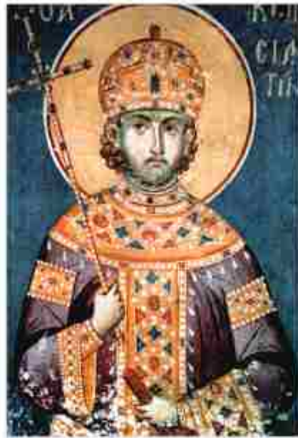
Святой равноапостольный Константин

В 303 году началось очередное гонение на христиан. Историки полагают, что подлинным виновником его нужно считать не престарелого Диоклетиана, а Галерия. Процесс реформирования империи, забота об идейном укреплении посредством религии вызвали один из последних всплесков гонений. Так же как и восточный август, Галерий вышел из низов. После удачного персидского похода 296–298 годов он был овеян славой победителя и имел большой авторитет. До начала этого гонения христиане жили в относительном спокойствии около сорока лет. Они уже позволяли