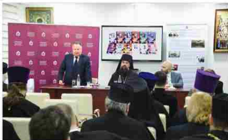
Презентация 12-томной книжной коллекции «Русские писатели-классики и православие» в Бакинской и Азербайджанской епархии

В Азербайджане повсеместно и свободно используется русский язык. В стране действует более 300 школ с обучением на русском языке, в библиотечных фондах Азербайджана имеется огромное количество книг русских классиков как на азербайджанском, так и на русском языках.