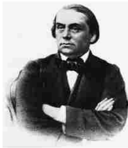
Иван Александрович Гончаров

Говоря о сильной России в понимании Гончарова, следует упомянуть его государственную службу в департаменте внешней торговли в качестве переводчика в середине 1830-х годов. Известно, что в ведении Ивана Александровича находились документы по таможенному и судному отделениям, а также по общей канцелярии, и он был в курсе основных экономических проблем, стоявших в те годы перед