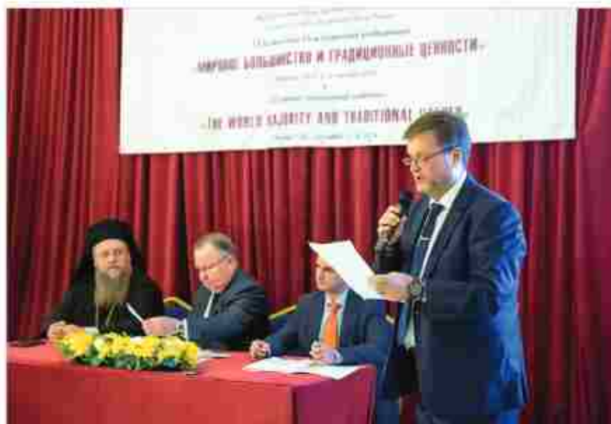
Президиум конференции. Генеральный консул РФ в Дубае О.О.Фомин зачитывает приветствие от руководства Министерства иностранных дел РФ

В 1820 году британцы заключили с шейхами наиболее влиятельных местных племен договор о «вечном мире». В результате данного и последующих (в 1853 и 1892 годах) соглашений территория будущих ОАЭ была переименована в Договорный Оман и, по сути, превратилась в британский протекторат.