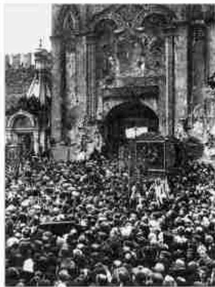
у Никольских ворот Кремля, 1918 г.