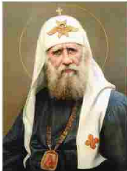
Патриарх Московский и всея России Тихон

Однажды семинаристы окружили его в коридоре и, размахивая самодельным кадиллом, прыскавая в кулак, хором забасили: «Вашему Святейшеству — много лет!» Позже, закончив Петербургскую духовную академию и обрета уже небольшую бородку, Василий Иванович преподавал в той самой семинарии богословие и французский язык. Его ученик Борис Царевский вспоминал, как молодой