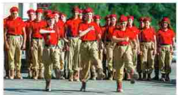
Юнармейцы на марше, 2024 г.

Некоторые музеи являются частными, их создают люди, которым интересна тема войны, именно они формируют другую группу, которая считает, что факт победы стоит помнить всегда, но они относятся к изучению темы войны в прикладном, т.е. практиче-