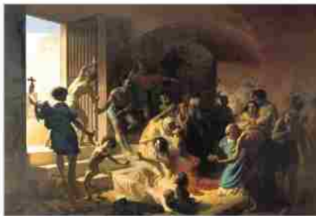
«Христианские мученики в Колизее». Худ. К.Д. Флавицкий, 1862 г.

В 250 году император Деций издал указ, предписывающий преследовать людей, не почитающих языческую римскую религию. При этом инициатива по обнаружению таковых отдавалась руководству провинций. Текст этого указа до нас не дошел. На практике он коснулся преимущественно церковных руководителей, епископов. От христиан требовали не только отречения от Христа, но и принесения языческой жертвы. В это