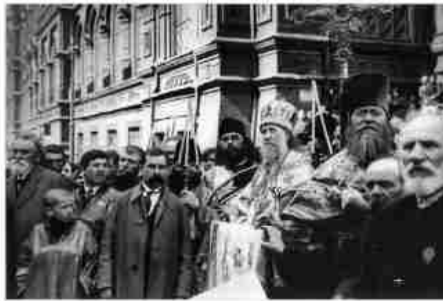
Патриарх Тихон с народом. Москва, 1918 г.

«Почему бы Церкви не отдать свои богатства голодающим, ведь это было бы по-христиански?!» — вопрошали