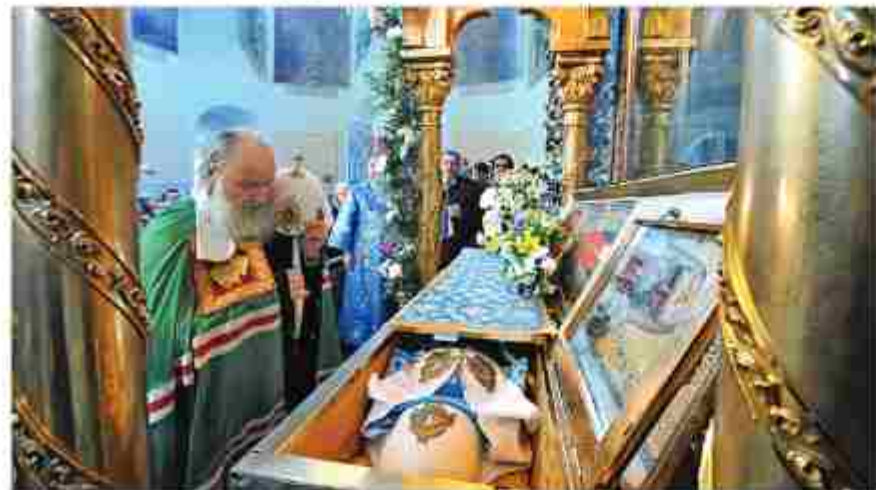
Святейший Патриарх Московский и всея Руси Кирилл у мощей Патриарха Тихона в Донском монастыре, 2011 г.

Андрей САМОХИН, член Союза писателей России