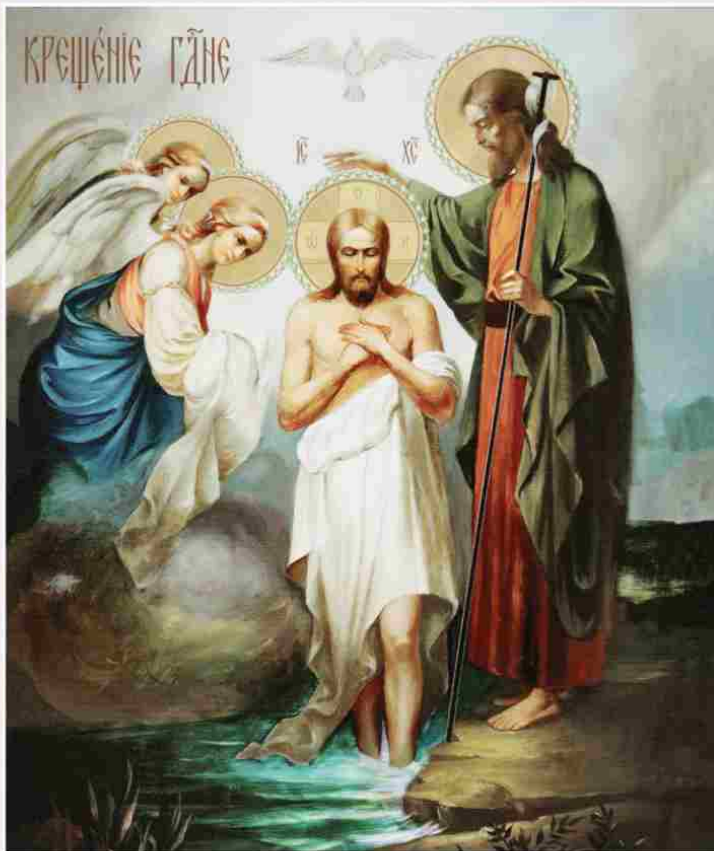
Крещение Господне. Икона XXI в. (Россия)