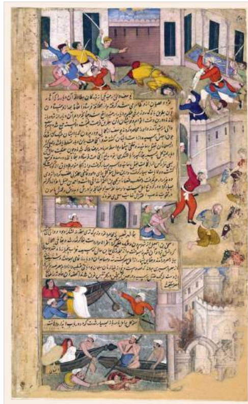
Разрушение могилы имама аль-Хусейна в Кербеле

В городе много больных и калек, приехавших издалека в надежде найти исцеление у могилы аль-Хусейна. Когда они переходят улицу с помощью сердобольных прохожих или ребятишек, идущие машины и фаэтоны останавливаются и пропускают их. Почти на каждой улице можно видеть баки с водой — хибб. Они поставлены для паломников состоятельными людьми, которые не забывают написать на баках свои имена. У баков или у выведенных на улицу водопроводных кранов на длинных цепочках висят простые жестяные кружки. Над некоторыми из них прикреплены черные полотна с надписями: