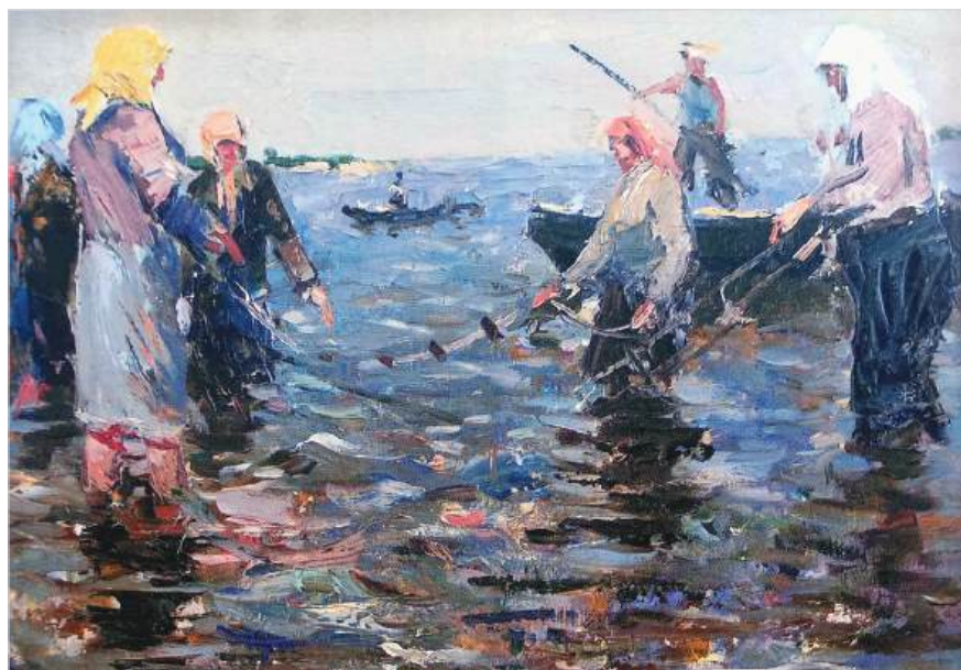
Притонение. Худ. К.Д. Иноземцев, 1964 г.

Художники средствами живописи воспевают красоту родного края и всего окружающего Богосозданного мира, перед нами в их работах предстает поэтика творческого художественного отображения реальности, что, безусловно, возвышает и наше зрительское восприятие представленных картин и пейзажей. Высокое искусство всегда поэтично, ибо творчество настоящего художника несомненно питается токами высоких божественных духовных энергий, ниспосылаемых свыше избранным, на чью долю выпадает счастливая судьба получить в дар талант от Подателя всех благ,