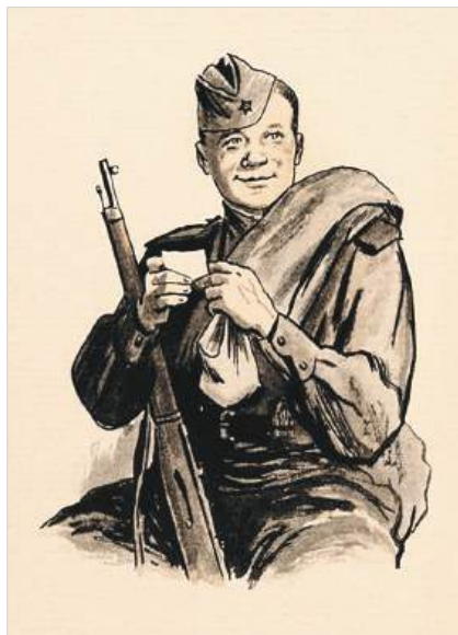
Василий Теркин. Худ. О. Верейский, 1961 г.

Грянул год, пришел черед, Нынче мы в ответе За Россию, за народ И за все на свете. От Ивана до Фомы, Мертвые ль, живые, Все мы вместе — это мы, Тот народ, Россия. И поскольку это мы, То скажу вам, братцы, Нам из этой кутерьмы Некуда деваться. Тут не скажешь: я — не я, Ничего не знаю, Не докажешь, что твоя Нынче хата с краю.