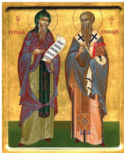
Святые равноапостольные Кирилл и Мефодий. Икона XIX в.

В конце 850-х годов братья, ставшие к тому времени уже довольно известными персонами, сформировали вокруг себя круг единомышленников, сложившийся при монастыре, которым управлял Мефодий. В 860 году братья Кирилл и Мефодий были