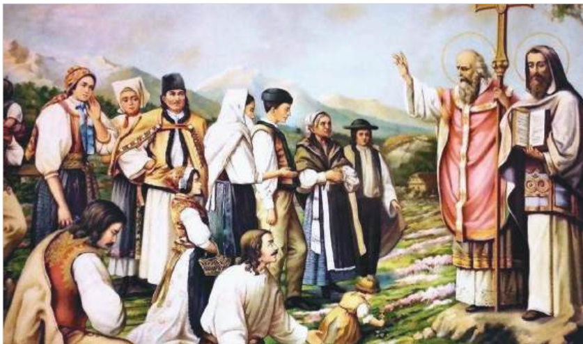
Святые равноапостольные Кирилл и Мефодий проповедуют среди славян

посланы императором для выполнения особой «хазарской миссии». В ее ходе Константин пытался уговорить хазарского кагана — главу огромного иудейского государства, раскинувшегося от Каспийского моря до Черного со столицей Итиль в районе дельты Волги, где сегодня примерно находится Астрахань, принять христианскую веру. Миссия закончилась тем, что каган отказался переходить из иудаизма в христианскую религию, а братья вернулись в Византию, но не с пустыми руками: они привезли много полезной для Константинополя — Нового Рима информации. Эта информация помогла империи в налаживании отношений с Хазарией.