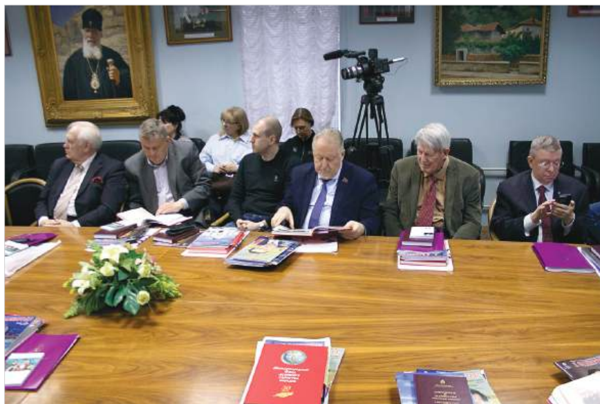
Участники Годичного собрания

Аналогичные проблемы Фонд испытывает и в Болгарии, где заморожена деятельность офиса МФДЕН, расположенного в центре Софии, а также работа большого детского центра в Варненской области, в городе Бяла. Вместе с тем в Болгарии продолжает свою работу Русский клуб «Бяла», который является партнером МФДЕН и его Болгарского Отделения и располагается на площадях, принадлежащих Фонду. Простые рядовые болгары приходят в этот клуб, где прово-