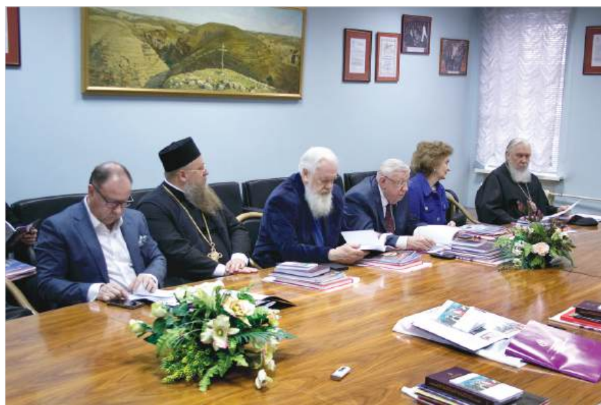
Участники Годичного собрания