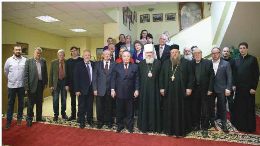
Участники Годичного собрания

И по традиции по завершении Собрания все его участники сфотографировались на память.