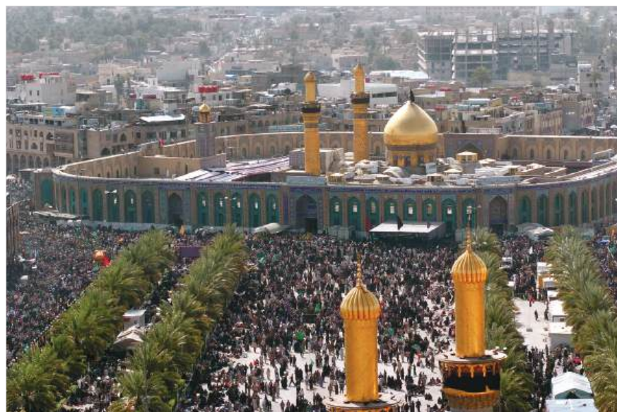
Мечеть аль-Хусейна в Кербеле

Над стенами вокруг мечетей аль-Хусейна и аль-Аббаса и примыкающими к ним зданиями трепещут на ветру зеленые, черные и красные полотнища. Зеленый цвет — традиционный цвет ислама. Под зеленым знаменем мусульмане завоевали половину известного им мира. На лубочных картинках, завезенных из Ирана, пророк Мухаммед и халиф Али всегда изображаются в зеленых чалмах. Черное знамя аббасидских халифов принято ими в знак траура по убитым потомкам Али. По мусульманскому преданию, отряд имама аль-Хусейна сражался с халифскими солдатами под красным знаменем. Вот почему