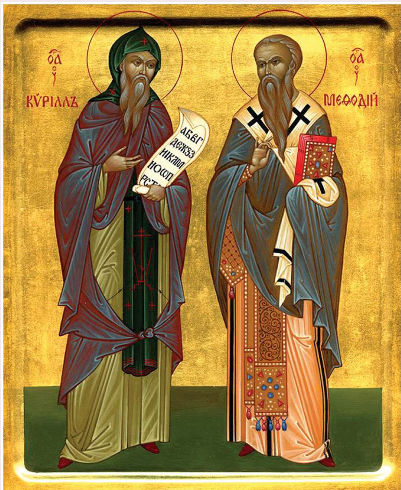
Святые равноапостольные братья Кирилл и Мефодий. Икона XIX в.