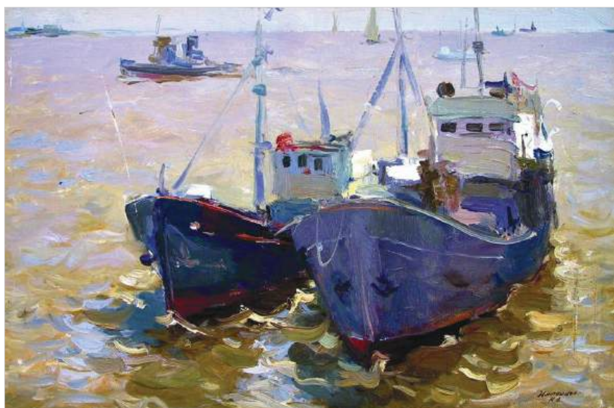
На рейде. Худ. К.Д. Иноземцев, 1964 г.

Главное в творчестве этих художников, ставших большими зрелыми мастерами, получившими высокие звания и широкое общественное и профессиональное признание, — это художественная правда, как говорили в советское время, социальный реализм, продолжающий направление великой русской художественной школы от замечательных художников-передвижников и других гигантов — И.Н.Крамского, В.Г.Перова, И.И.Шишкина, И.Е.Репина, И.И.Левитана, А.К.Саврасова и многих иных, в XIX веке творивших, до мастеров более позднего времени в XX веке — Гелия Рябова, Юрия Пименова, Александра Герасимова, Ильи Глазунова, Виктора Попкова. Трудно перечислить их всех, заслуживших народную славу своим богатым талантом и высоким творчеством.