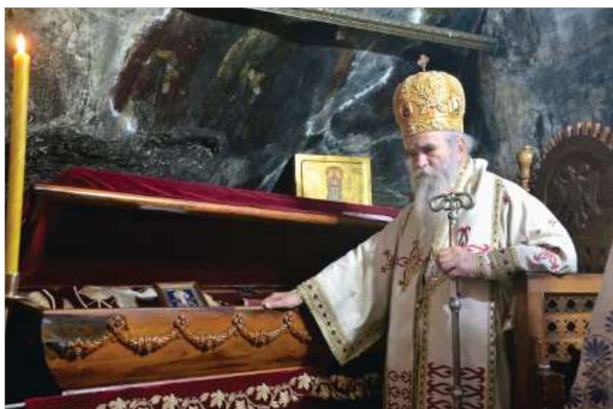
Митрополит Амфилохий у мощей святителя Василия Острожского

В то же время нельзя не учитывать, что православное сообщество Черногории в последние