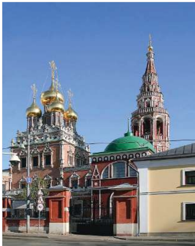
Храм Воскресения Христова в Кадашах

В Кадашевской церкви четыре престола. Главный — в честь Воскресения Христова — находится в верхнем, летнем храме. Три других — Успения Божией Матери, Тихвинской иконы, Святого Николая Чудотворца — расположены в нижнем храме, отапливаемом двумя изразцовыми печами.