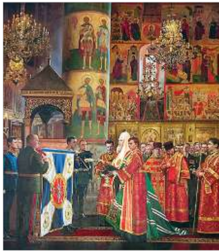
«Освящение боевого знамени Президентского полка Патриархом Московским и всея Руси Алексием II в Успенском соборе Московского Кремля 6 мая 2006 года». Худ. Ю.А.Бирюков

Всего за годы войны Московский Кремль подвергался бомбардировкам восемь раз — пять в 1941 году и три раза в 1942 году (последняя бомбежка зафиксирована 29 марта 1942 года). На Московский Кремль и его ближайшее окружение — Александровский сад и Красную площадь было сброшено 15 фугасных (от 50 до 1000 кг), 151 зажигательных, несколько осветительных бомб. Людские потери от бомбардировок в гарнизоне следующие: убито, пропало без вести, умерло от ран — 94 военнослужащих, тяжело ранено — 88, легко ранено — 76 человек.