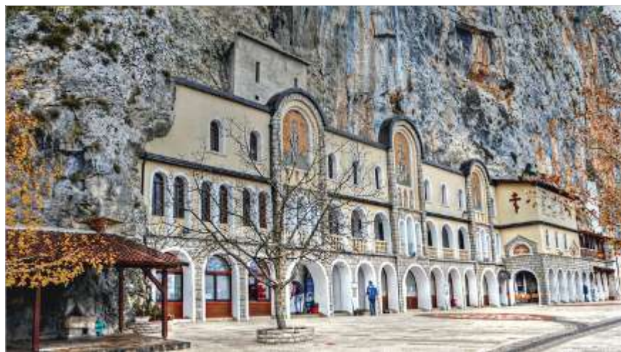
Монастырь святителя Василия Острожского в Черногории

В настоящее время Черногория стоит на перепутье: вступив в НАТО, она активно стучится в двери ЕС. Стоящие у руля молодой республики политики забывают, что входной билет в Евросоюз означает принятие не только политико-экономической программы развития, что в случае большинства членов союза означало отказ от собственного суверенитета, но и так называемых гражданских неолиберальных ценностей. Символическим актом согласия черногорского политика идти в одну ногу с Брюсселем стало прозвучавшее летом 2025 года заявление черногорского правительства о намерении бесплатно предоставить Ватикану значительный земельный участок в центре Подгорицы