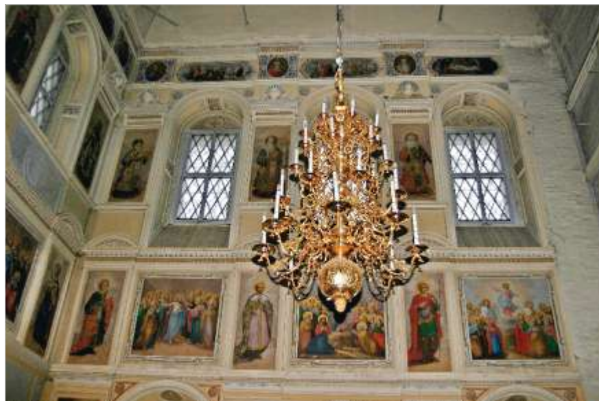
Храм Воскресения Христова в Кадашах

Среди особо почитаемых святынь храма — образ святого Царя-мученика Николая, написанный на кирпиче из разрушенного в наши дни Ипатьевского дома (Екатеринбург), где завершился мученический путь Царской семьи; Почаевская и Тихвинская иконы Божией Матери; образ преподобного Иова, игумена Почаевского; икона Святых Новомучеников и Исповедников Российских — это второй список иконы, оригинал находится в храме Христа Спасителя. Обе иконы были написаны преподавателями и студентами Православного Свято-Тихоновского гуманитарного университета (ПСТГУ) к прославлению Святых Новомучеников