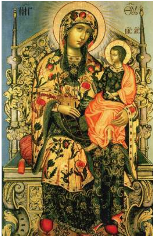
Кадашевская икона Божией Матери

В храме Воскресения Христова в Кадашах покоятся мощи некоторых святых: Оптинских старцев (икона с мощевиками), преподобноисповедника