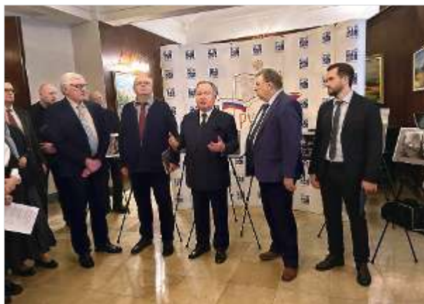
Открытие фотовыставки о Великой Отечественной войне