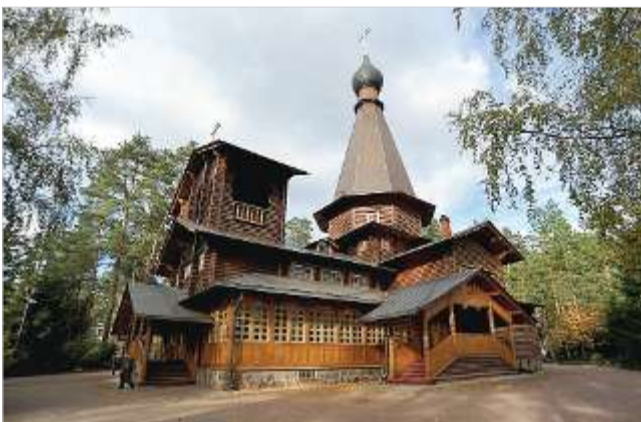
Казанская церковь в Вырице