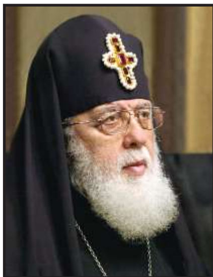
Святейший и Блаженнейший Католикос-Патриарх ИЛИЯ II (4.01.1933 – 17.03.2026)