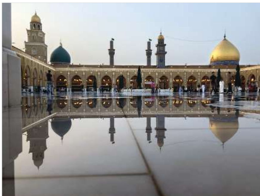
Соборная мечеть в Куфе

Рядом с крепостью, даже сейчас весьма внушительного