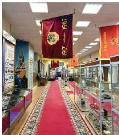
В музее Кремлевского полка

12 августа 1941 года при падении фугасной авиационной бомбы (1000 кг) в Арсенал погиб зенитный пулеметный расчет 11-й роты полка, возглавляемый лейтенантом Г.Г. Ходаревым (его имя носит мемориальная комната в здании Арсенала). Всего комендатура Московского Кремля потеряла в этот день убитыми 15 человек, 13 военнослужащих не были найдены, 40 ранены. На стенде читаем, что была разрушена восточная часть здания