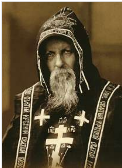
Преподобный Серафим Вырицкий

Будущий великий старец родился в деревне Вахромеево Рыбинского уезда Ярославской губернии 31 марта 1866 года у верующих (набожных, как тогда говорили) родителей, крестьян