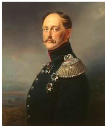
Портрет Императора Николая I. Худ. Ф.Крюгер, 1852 г.

что-нибудь верное в год. Сочинения ему мало приносят, и он в беспрестанной зависимости от завтрашнего дня. Подумайте об этом; вы лучше других можете охарактеризовать Гоголя с его настоящей, лучшей стороны». И вот Гоголь получает от государя «пенсион» по тысяче рублей в год на три года. Такую же сумму прибавил ему Наследник.