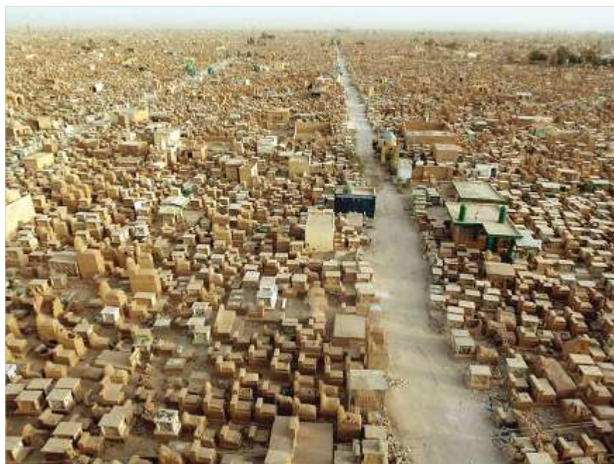
Мусульманское кладбище в городе Эн-Неджеф